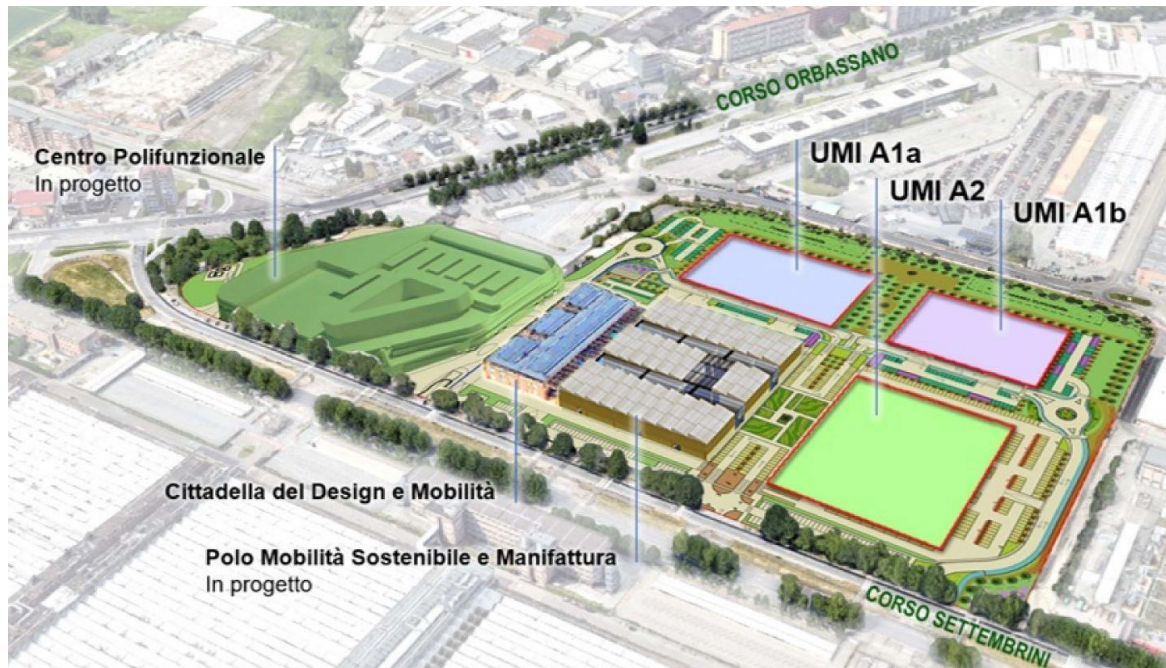
Planivolumetrico di Piano Esecutivo Convenzionato “Ambito 16.34 Mirafiori-A”

di vendita immobiliare - Unità Minime di Intervento A1a, A1b e A2” che regola la procedura in tutte le sue fasi, gratuitamente disponibile presso la sede di TNE o sul suo sito internet www.torinonuovaeconomia.it sezione Bandi e Gare.