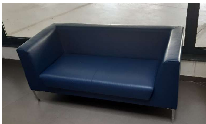
19) Divanetto (2) in pelle per Attesa Ospiti