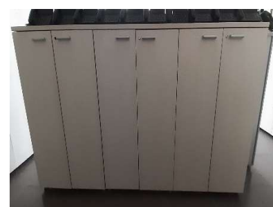
29) Armadio basso 4 ante