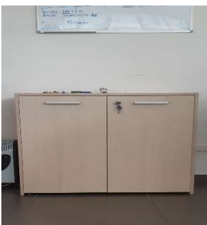
17) Armadio basso 2 ante