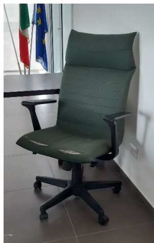
2) Poltrona Gir. (tessuto)