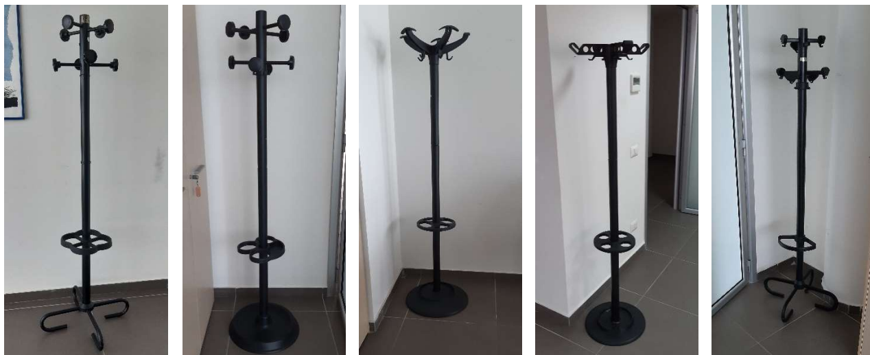
1) Attaccapanni a Piantana