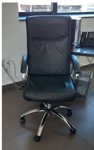
1) Poltrona Gir. (pelle)