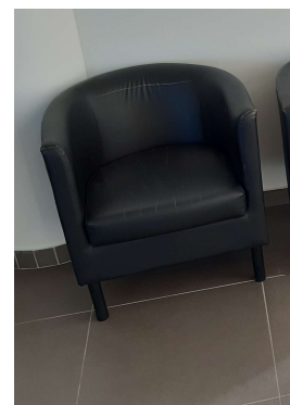
18) Poltroncina pelle