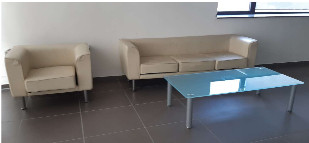
15) Divano in pelle per Ospiti (3 + 1) con Tavolino in Cristallo