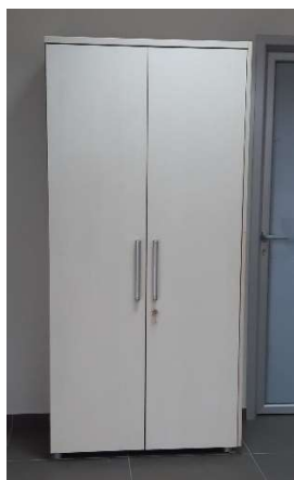
23) Armadio al. 2 ante