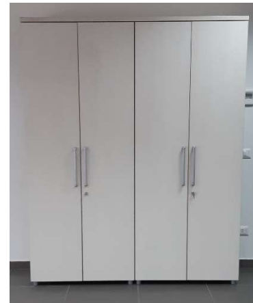
26) Armadio alto 4 ante