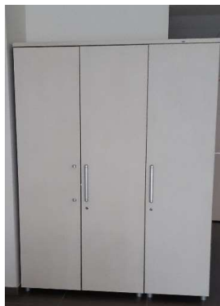
25) Armadio alto 3 ante