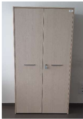
12) Armadio al. 2 ante