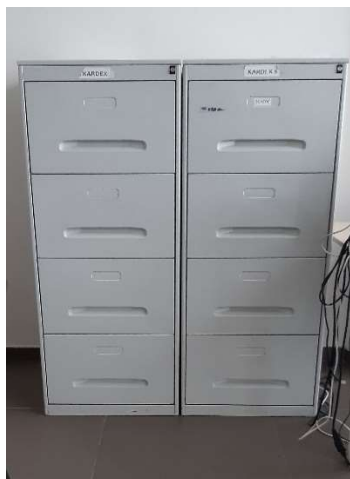
44) Classificatore 4 Cassettoni