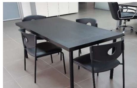
31) Scrivania (80x65) 32) Scrivania (120x80) 33) Dattilo (100 x 50) 34) Tavolo Riunione (150 x 75)