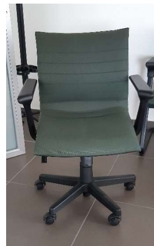
4) Sedia Gir. (tessuto)