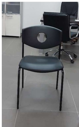
13) Sedia Fissa (pelle)