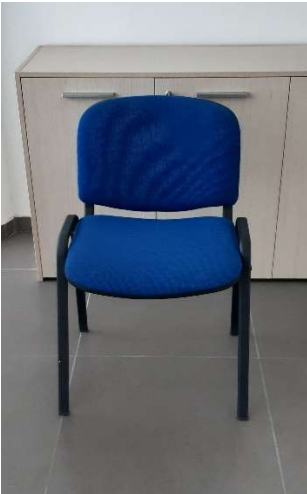
12) Sedia Fissa (tessuto)