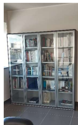
3) Armadio a. 4 Ante