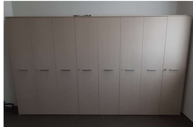
16) Armadio alto 8 ante