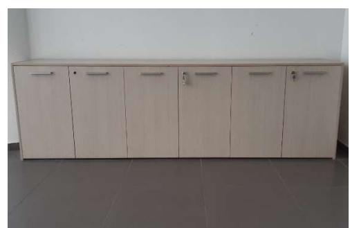
19) Armadio basso 6 ante