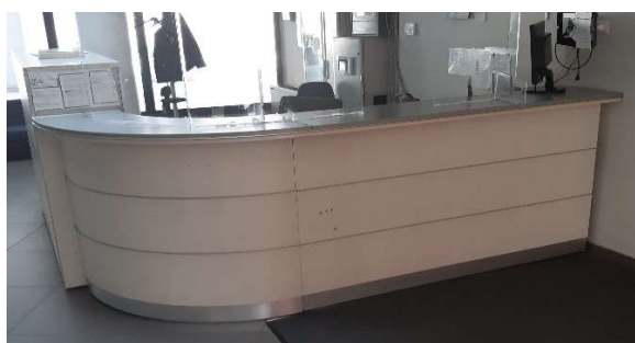
30) Banco Reception