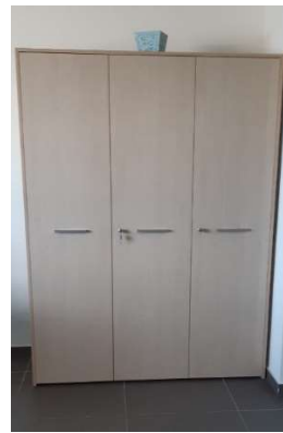
13) Armadio al. 3 ante