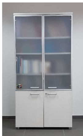
24) Armadio al. 2 ante