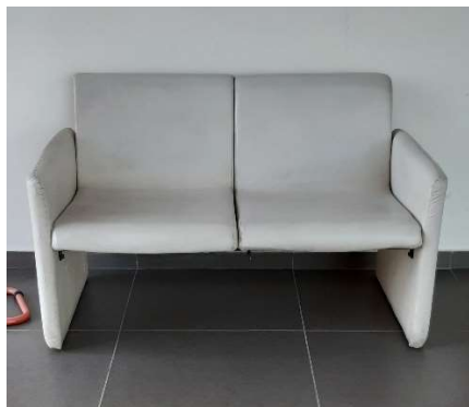
16) Poltroncine in pelle per Attesa (2 + 1)