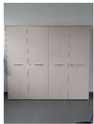
14) Armadio al. 4 ante