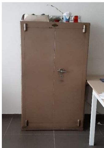
45) Cassaforte (80x45x150)