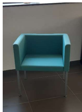
17) Poltroncina tessuto