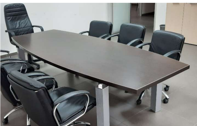
5) Tavolo Riunione 275 x 110