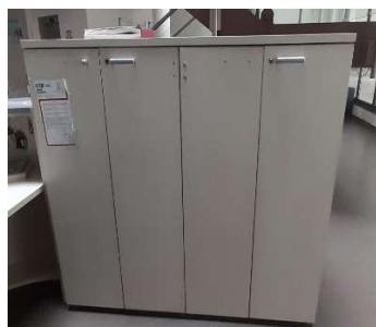
28) Armadio basso 2 x 2 ante