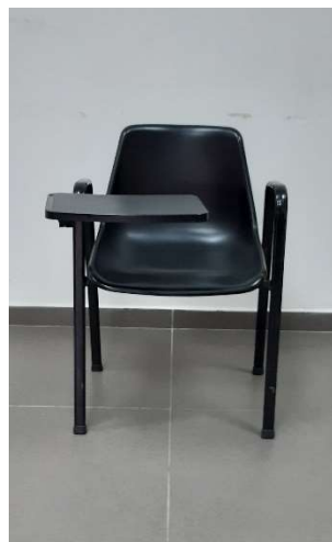
14) Sedia Fissa con Tavol.