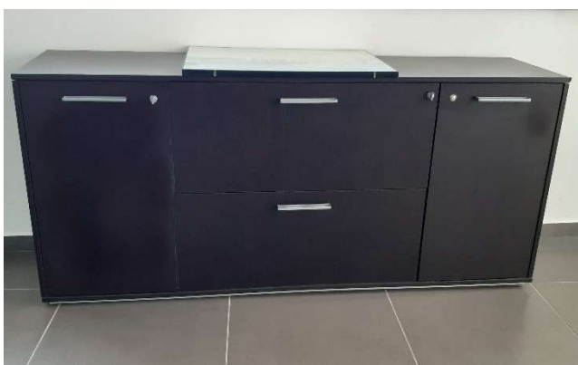
4) Mobile b. 2 Ante + 2 Cassettoni