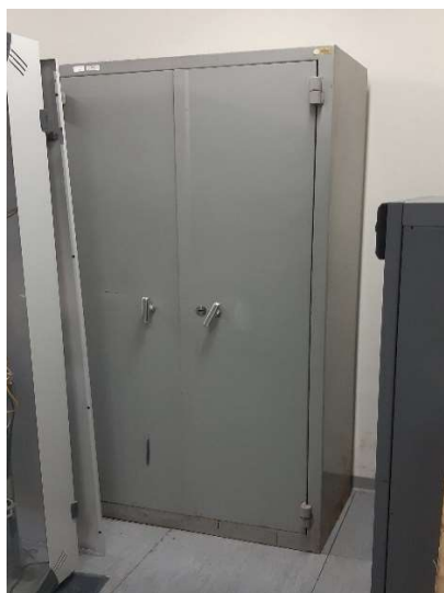
48) Armadio Sicur. (100x55x200)