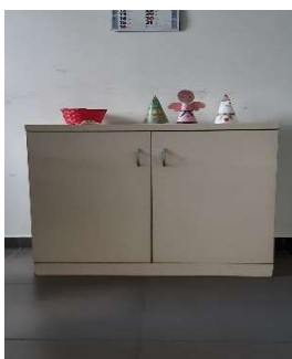
42) Armadio b.1 An.