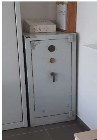
46) Cassaforte (55x50x120)