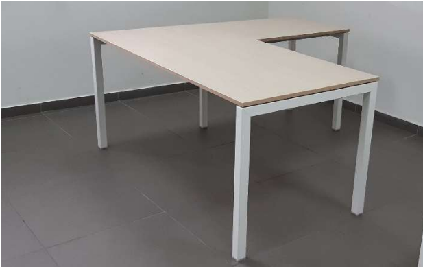
8) Scrivania Angolare (160 x 80 + 80 x 60)