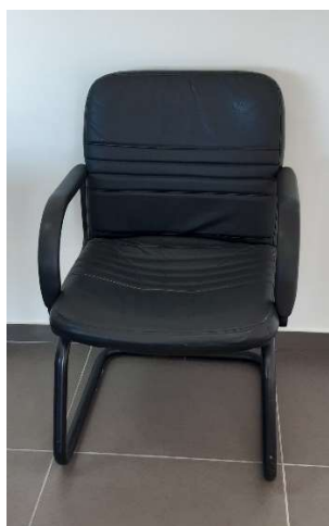
5) Sedia Fissa Br. (pelle)