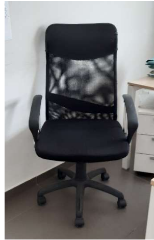
10) Sedia Girevole (ergon.)