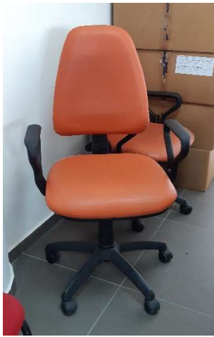
9) Sedia Girevole (pelle)