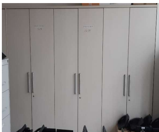
27) Armadio alto 6 ante