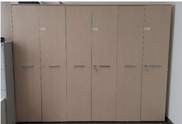
15) Armadio alto 6 ante