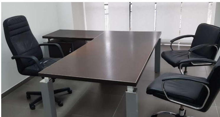
1) Scrivania Angolare (210 x 100 + 100 x 60)