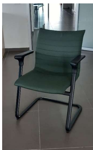
6) Sedia Fissa Br.(tessuto)