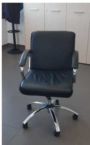
3) Sedia Gir. (pelle)