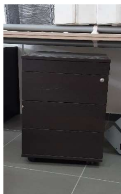
2) Cassettiera 3cs+1