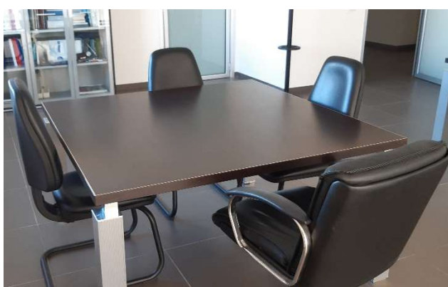
7) Tavolo Riunione 140 x 140