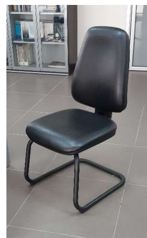
7) Sedia Fissa (pelle)