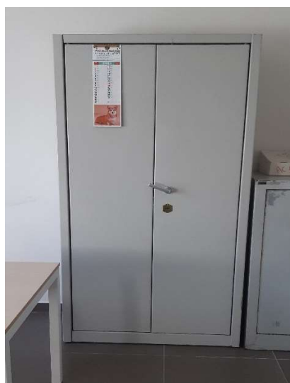
49) Armadio Sicur. (100x50x200)