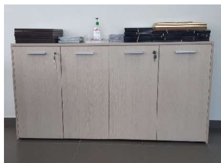
18) Armadio basso 4 ante