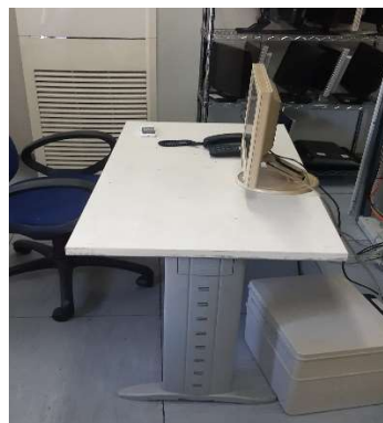
21) Scrivania (120 x 60)