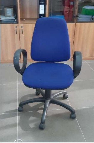
8) Sedia Girevole (tessuto)