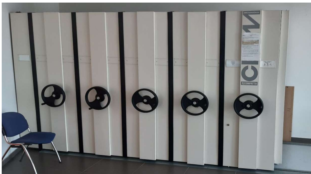
47) Scaffalatura Compattabile (5 Scomparti)