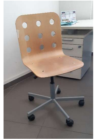
11) Sedia Girevole (legno)