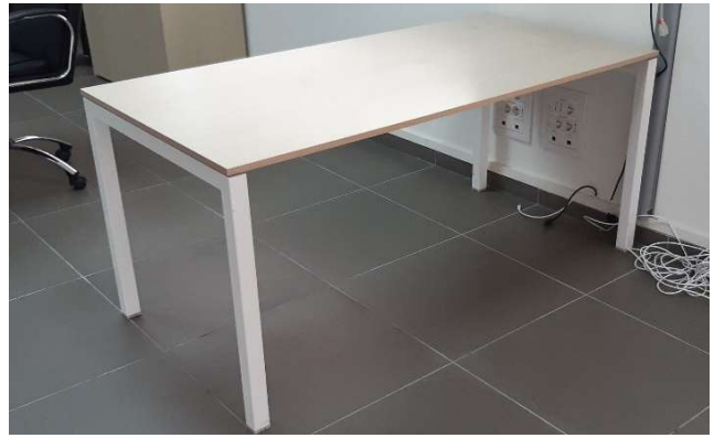
9) Scrivania (160 x 80)