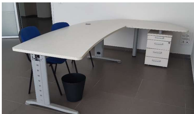
20) Scrivania Angolare (180x80 + 180x75) con Cassett.