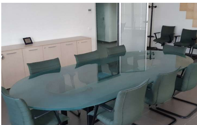
6) Tavolo Riunione in Cristallo 305 x 140