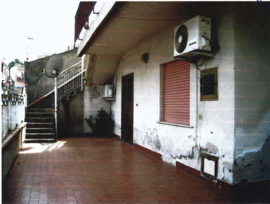
Foto A2: Vista dell'ingresso (lato Est) e, sullo sfondo, la scala di accesso al primo piano