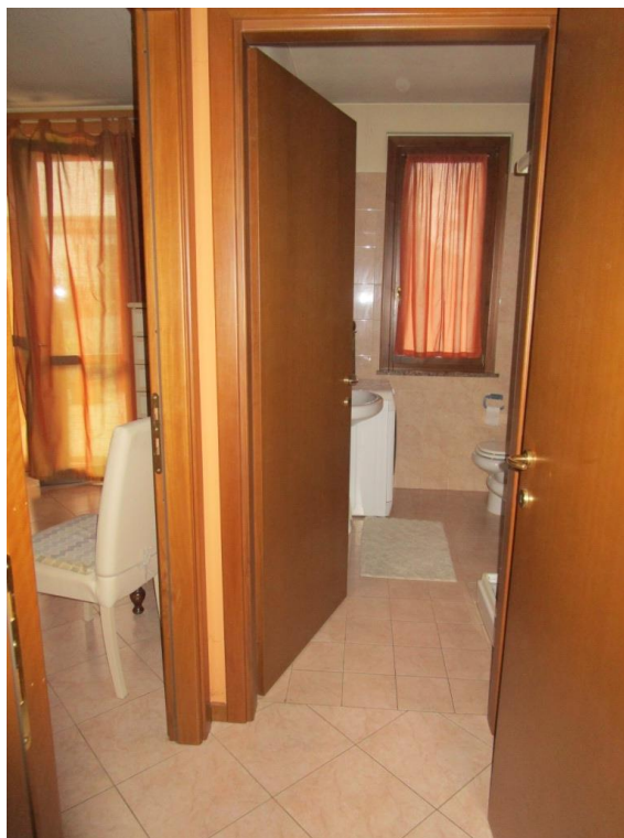
Foto 9 – Disimpegno di distribuzione del bagno e della camera da letto