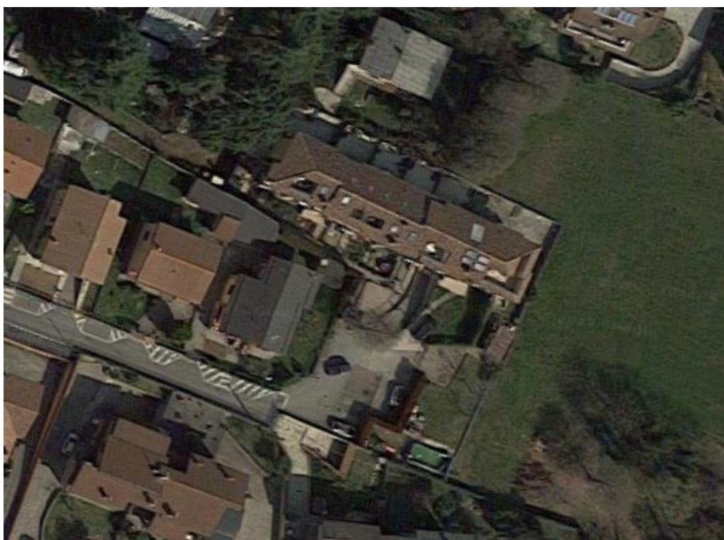
Stralcio ortofoto – vista aerea, localizzazione