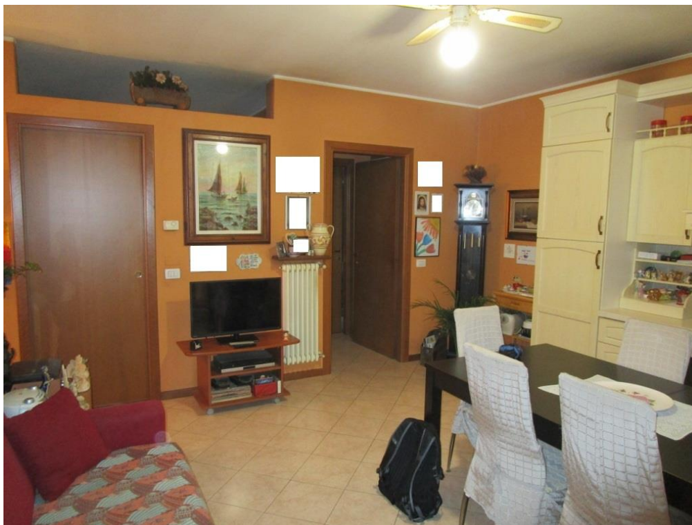
Foto 5 – Locale soggiorno dotato di angolo cottura e di scala interna di collegamento alla cantina