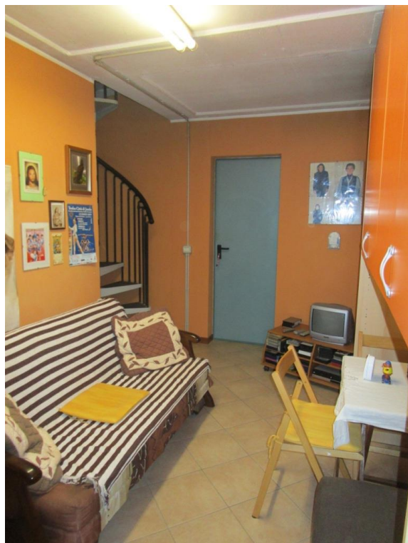
Foto 15/16 – Locale cantina al piano seminterrato dotata di porta di accesso all' autorimessa