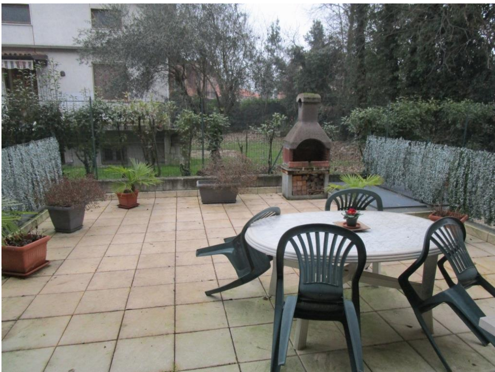
Foto 13 – Giardino esclusivo retrostante con accesso dalla camera da letto