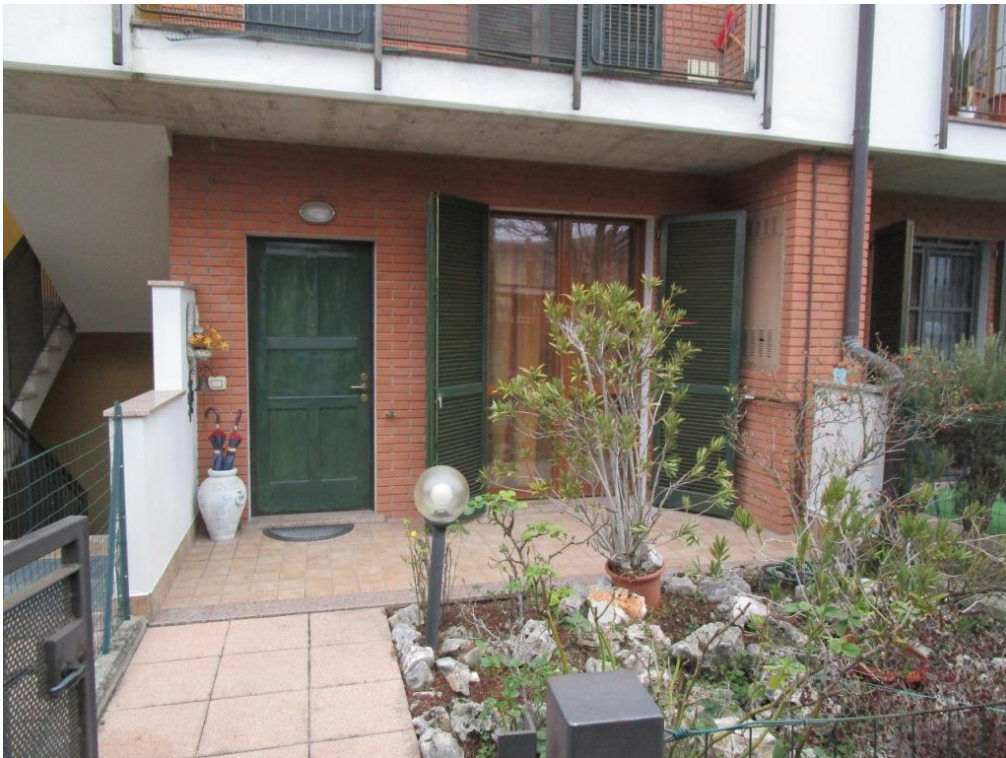
Foto 4 – Ingresso all'appartamento dotato di giardino esclusivo antistante