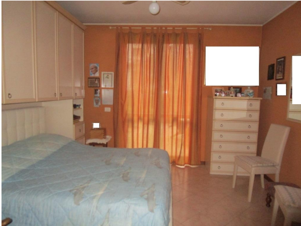
Foto 7 – Vista della camera da letto matrimoniale dotata di accesso al giardino esclusivo retrostante