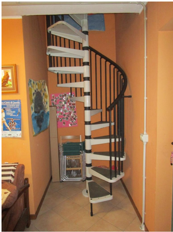
Foto 14 – Scala "a chiocciola" di collegamento tra il locale soggiorno e la cantina