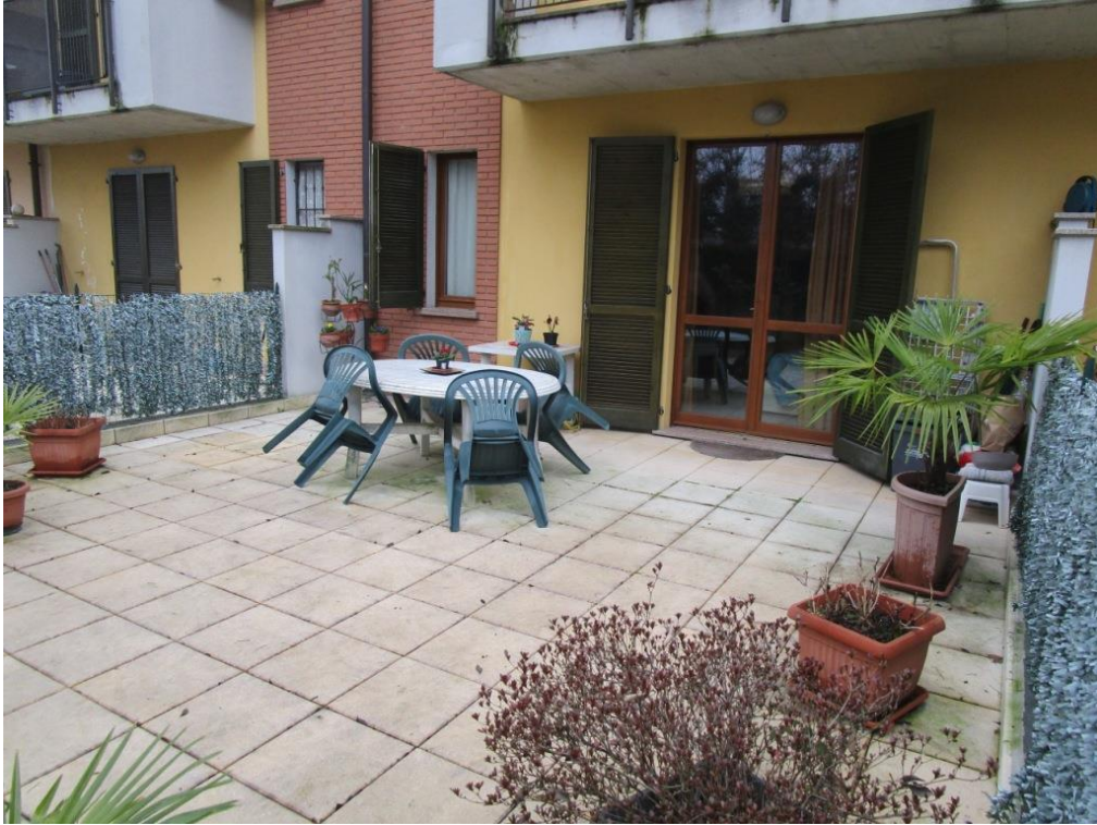
Foto 12 – Giardino esclusivo retrostante con accesso dalla camera da letto