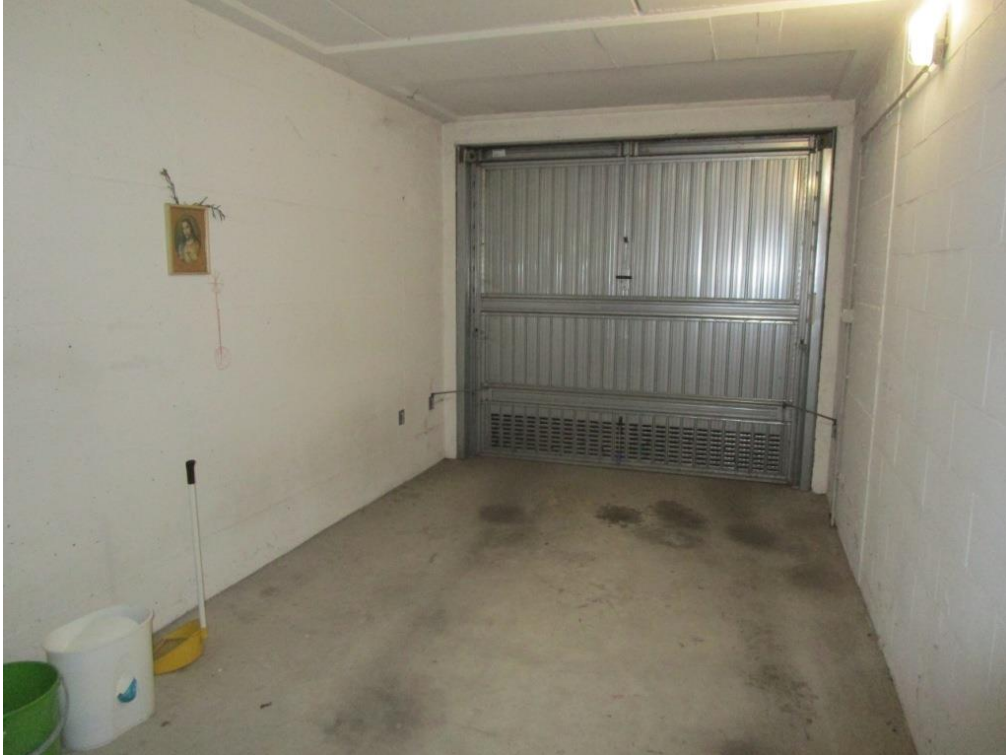
Foto 17 – Autorimessa collegata all'unità immobiliare residenziale