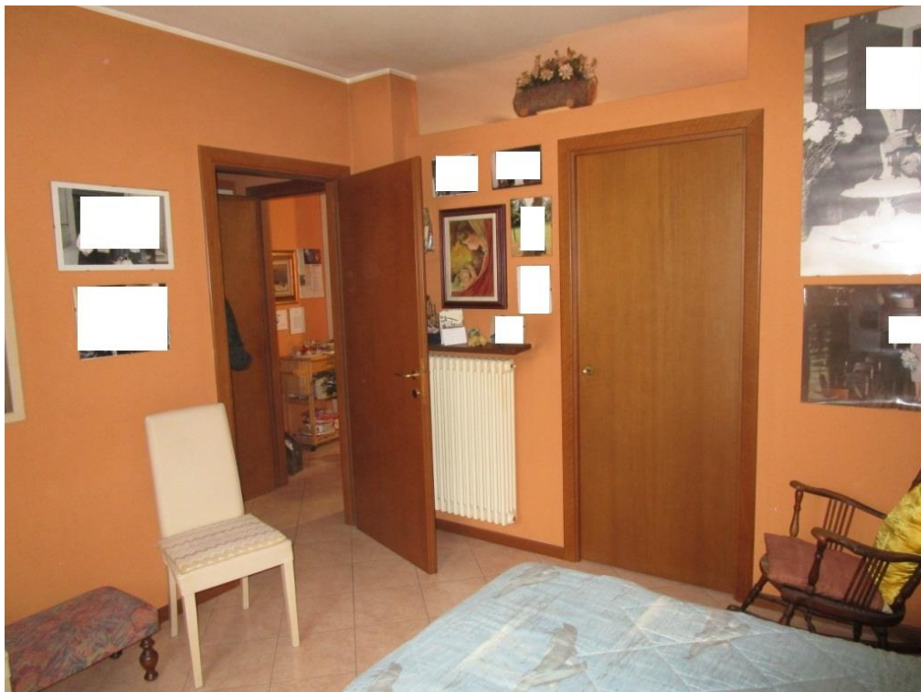
Foto 8 – Vista della camera da letto verso il disimpegno ed il soggiorno