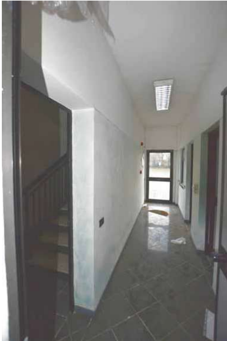
Foto 24 – U.i. “A.” Ingresso da corte di pertinenza e corpo scala