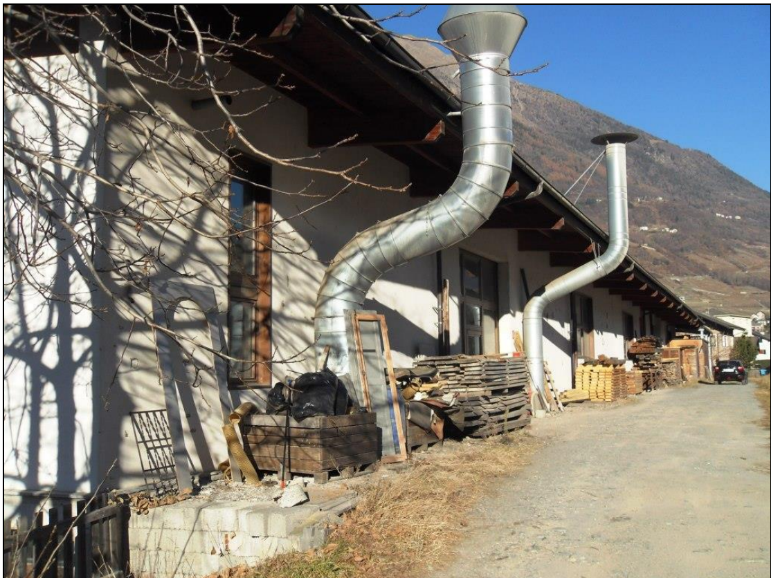
Facciata sud-est del fabbricato Fg. 32 mapp. 904-906-909 (vista da sud-ovest)