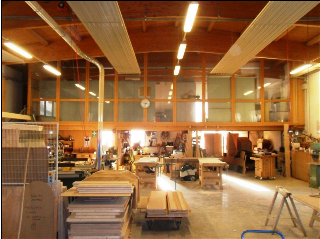
Interni piano terreno destinato a falegnameria (Fabbricato Fg. 32 mapp. 904-906-909)