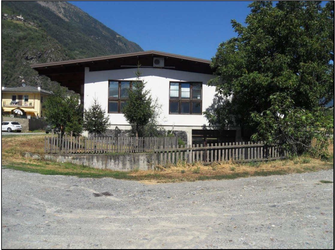
Facciata sud-ovest del fabbricato Fig. 32 mapp. 904-906-909 (vista da sud-ovest)