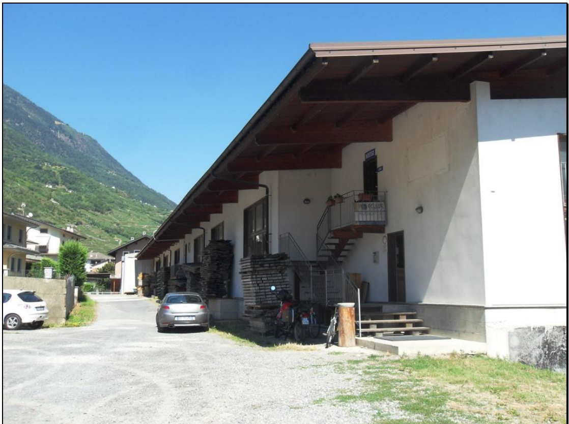
Facciata nord-ovest del fabbricato Fig. 32 mapp. 904-906-909 (vista da sud-ovest)