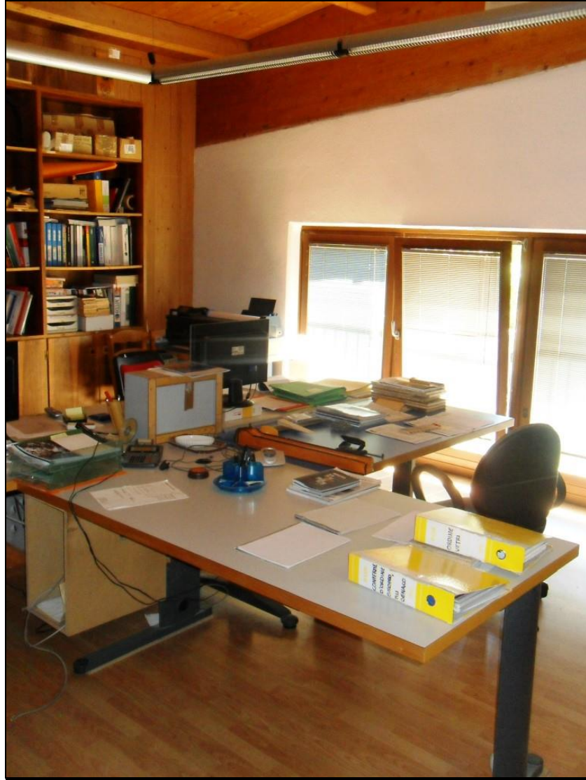
Interni piano soppalco destinato a uffici (Fabbricato Fg. 32 mapp. 904-906-909)