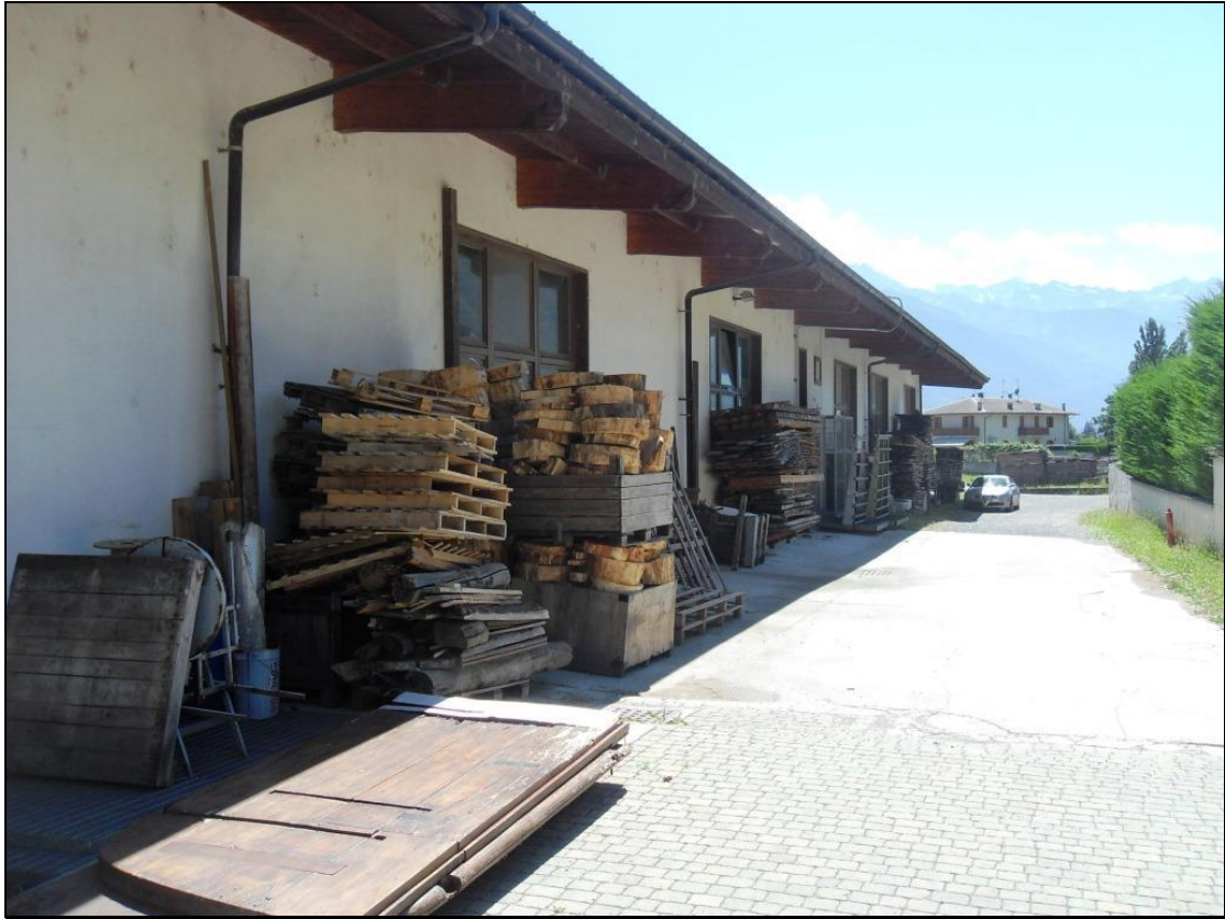
Facciata nord-ovest del fabbricato Fg. 32 mapp. 904-906-909 (vista da nord-est)