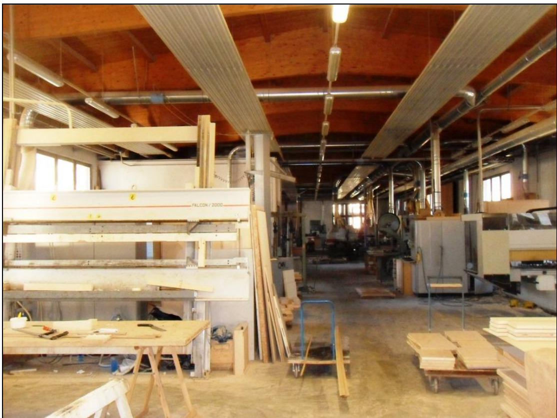
Interni piano terreno destinato a falegnameria (Fabbricato Fg. 32 mapp. 904-906-909)