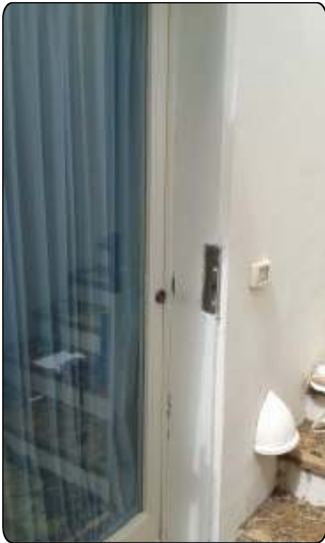
Foto 22- dettagli infissi esterni