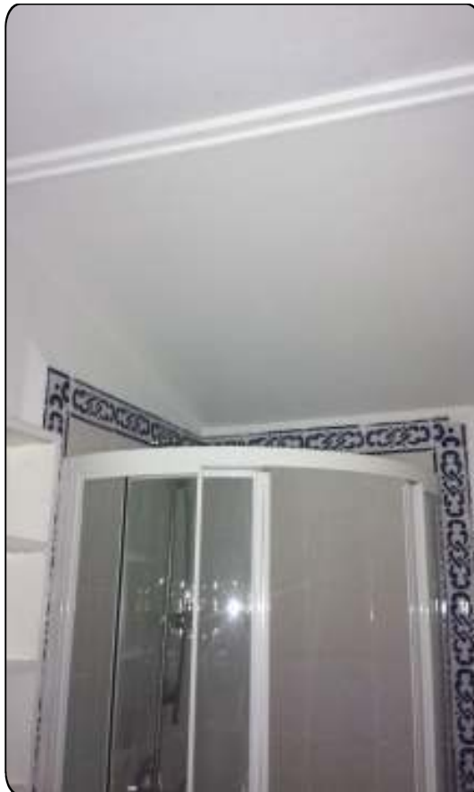
Foto 15- dettagli servizi