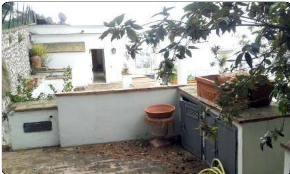
Foto 15- vista inferioe terrazza aggiunta