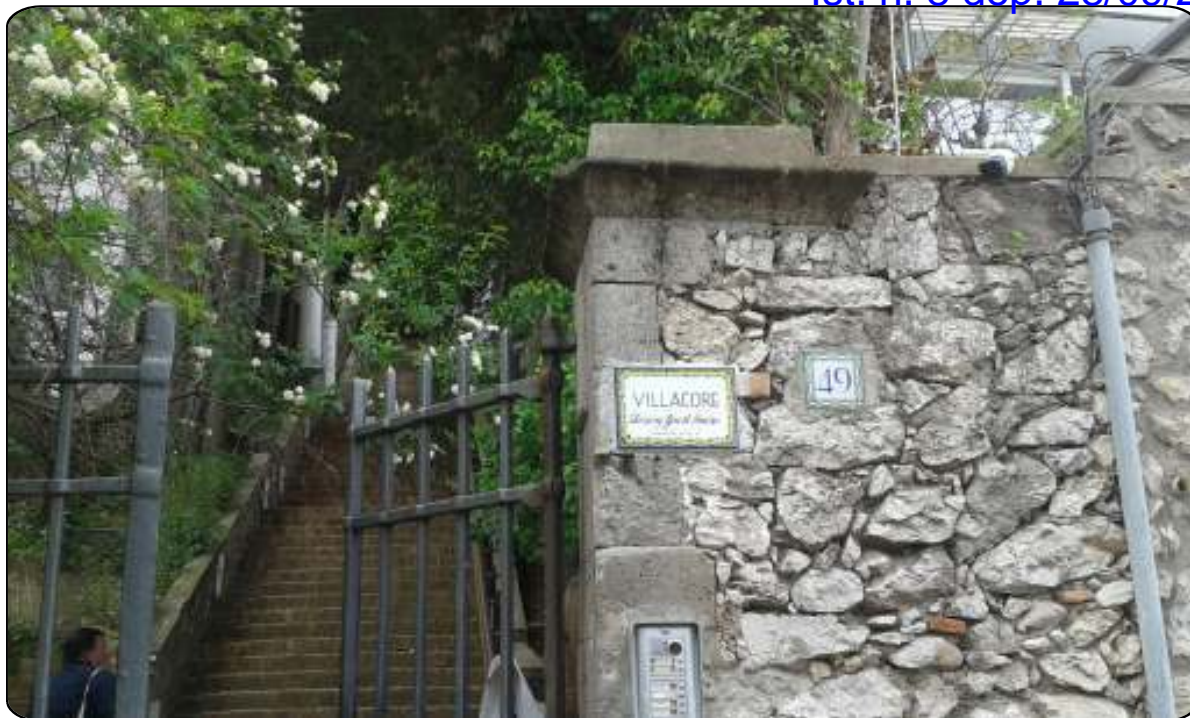
Foto 02- viale accesso