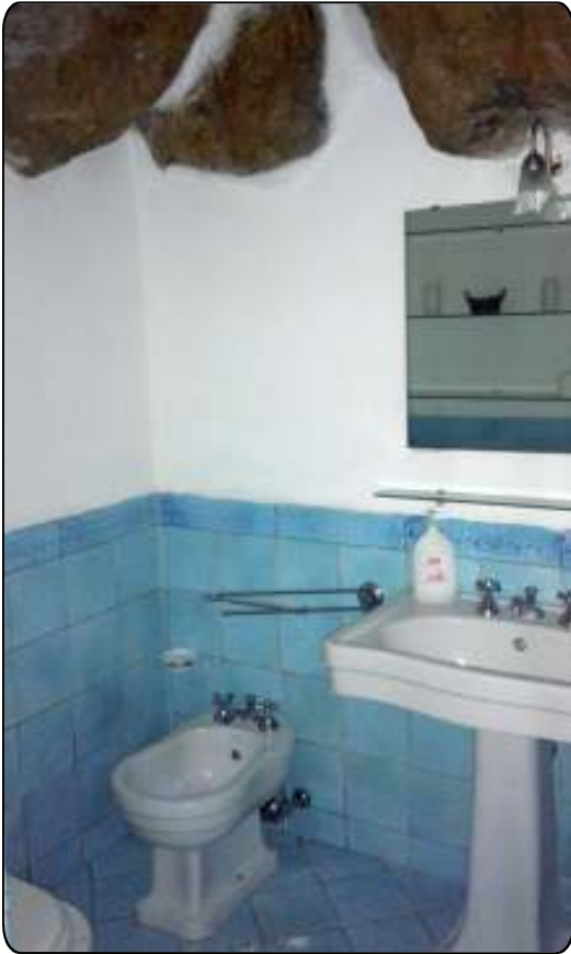
Foto 13- dettagli servizi