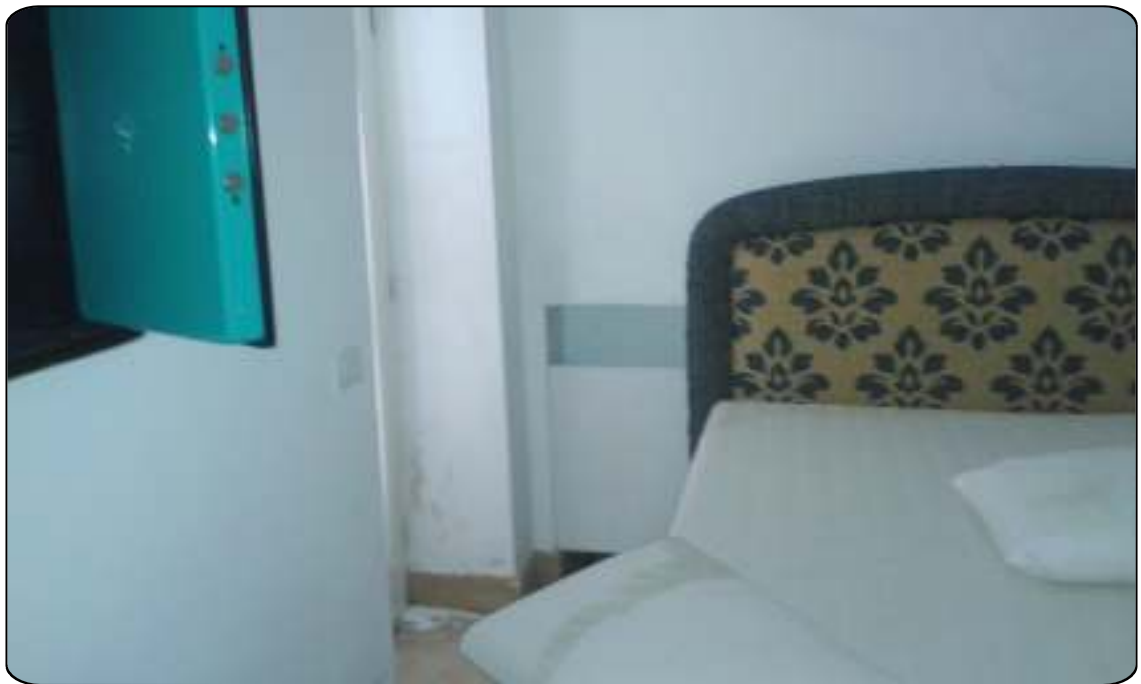
Foto 11- letto 2