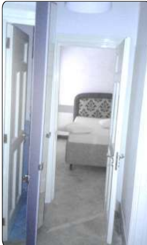
Foto 06- vista camera da letto 4