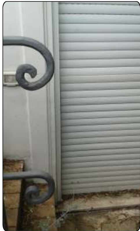
Foto 23- dettagli infissiinterni