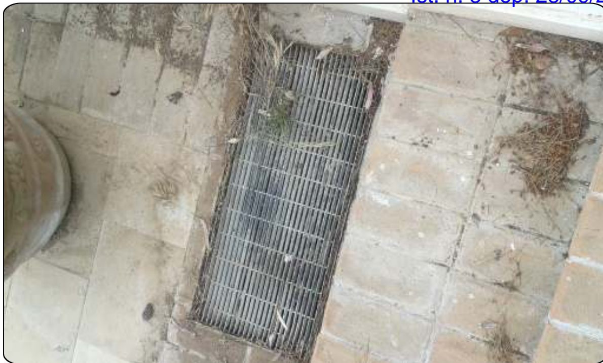
Foto 17- dettagli caditoie