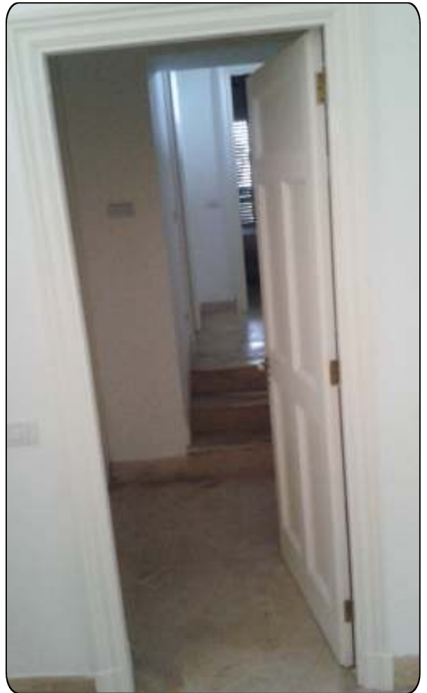
Foto 09- zona letto 1