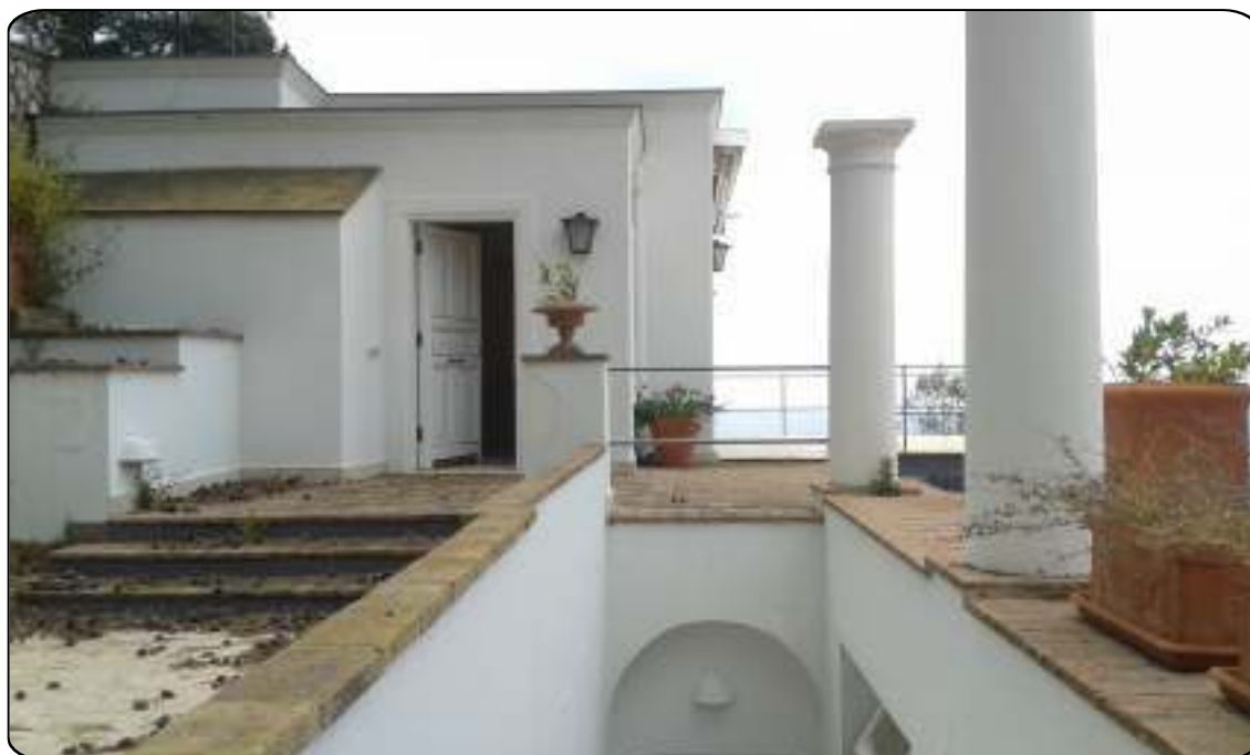
Foto 06- salone su terrazza