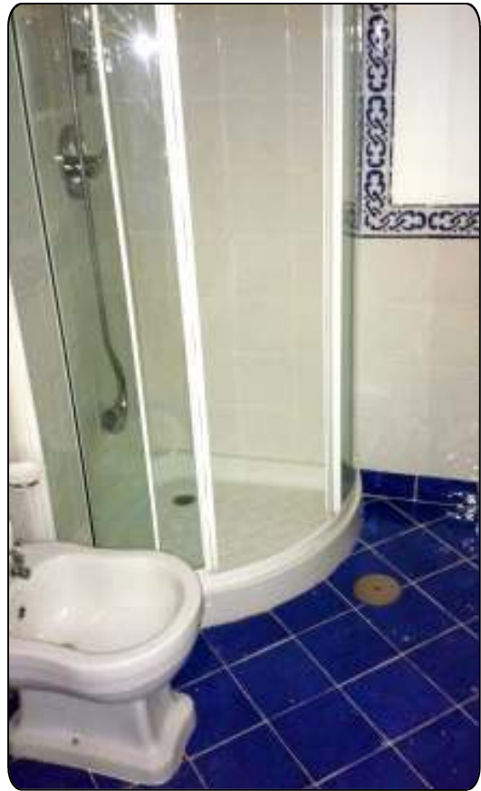
Foto 14- dettagli servizi