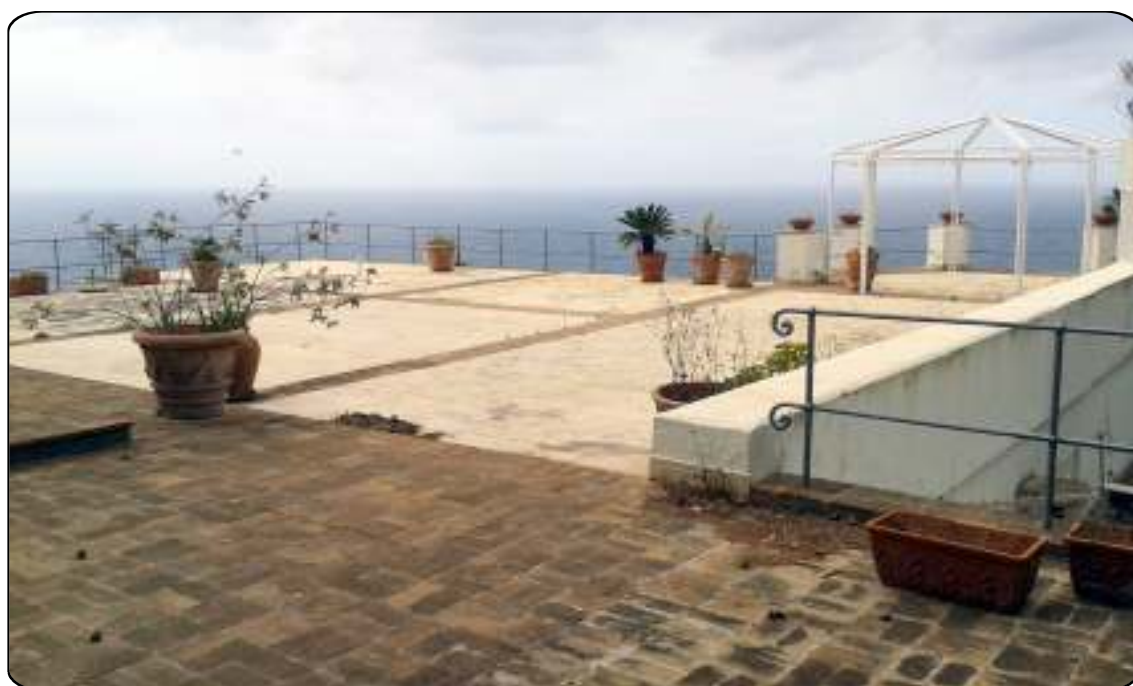
Foto 09- vista terrazzo