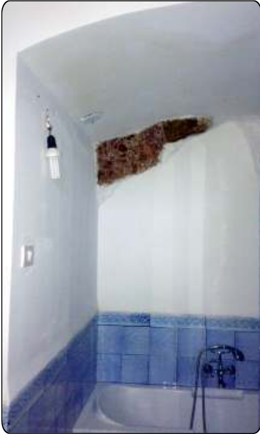
Foto 16- dettagli servizi