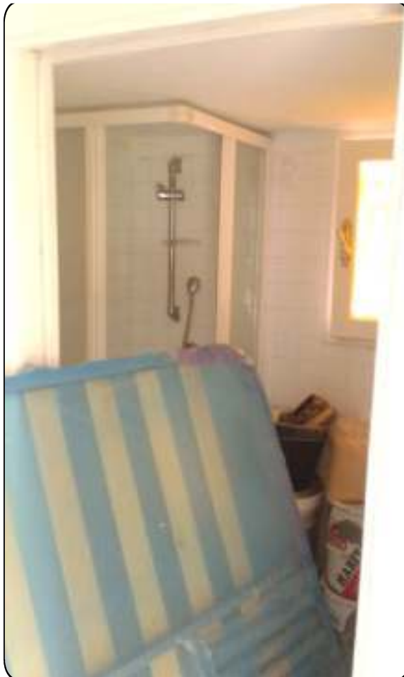
Foto 26- dettagli pavimenti