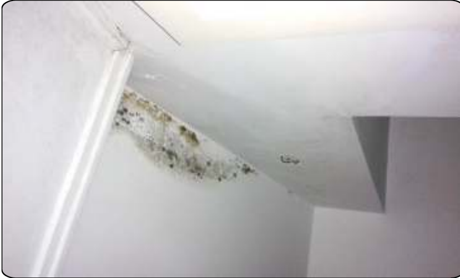
Foto 20- ammaloramenti