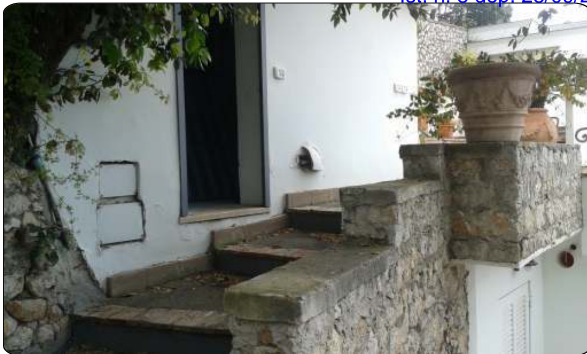
Foto 14- terrazzino su locale ext