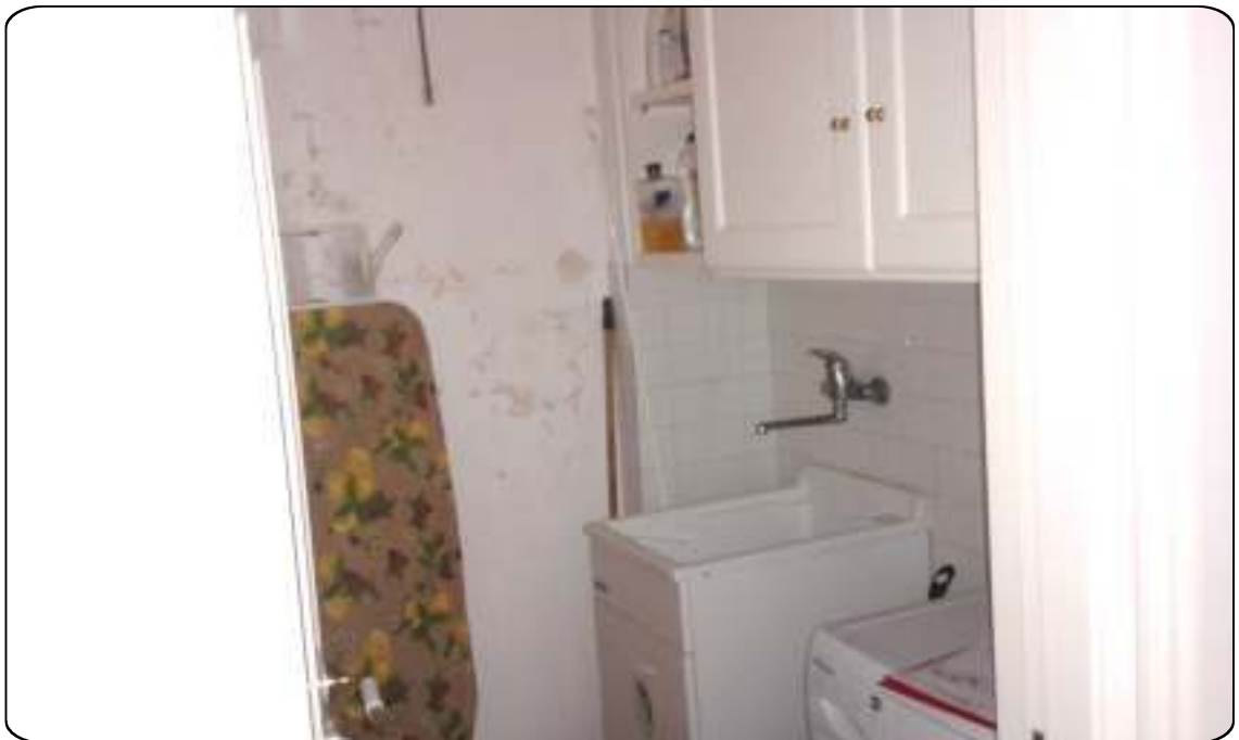
Foto 18- lavanderia