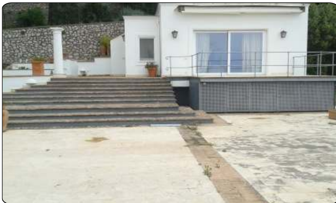
Foto 12- affaccio su faraglioni