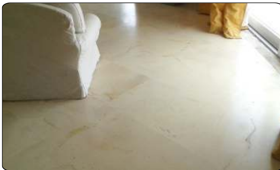
Foto 27- dettagli pavimento