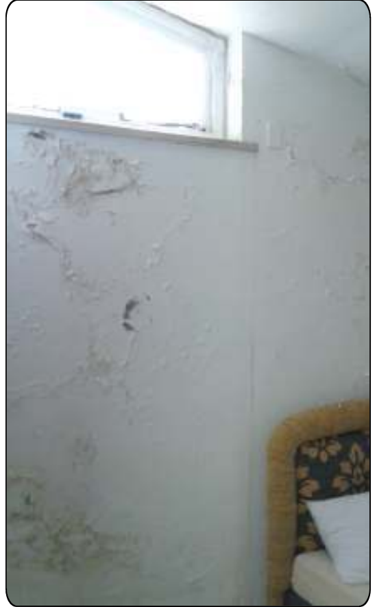
Foto 12- dettagli letto 2