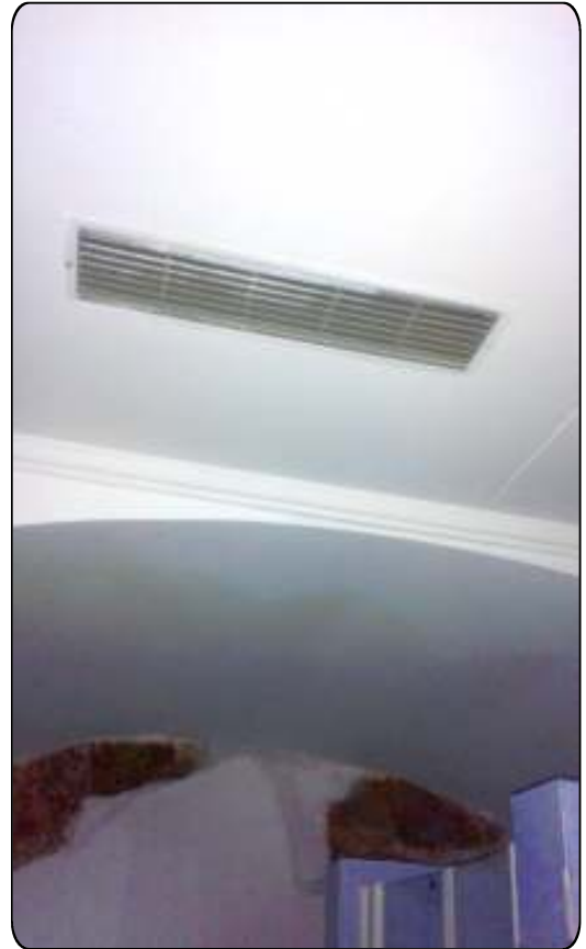
Foto 17- dettagli servizi