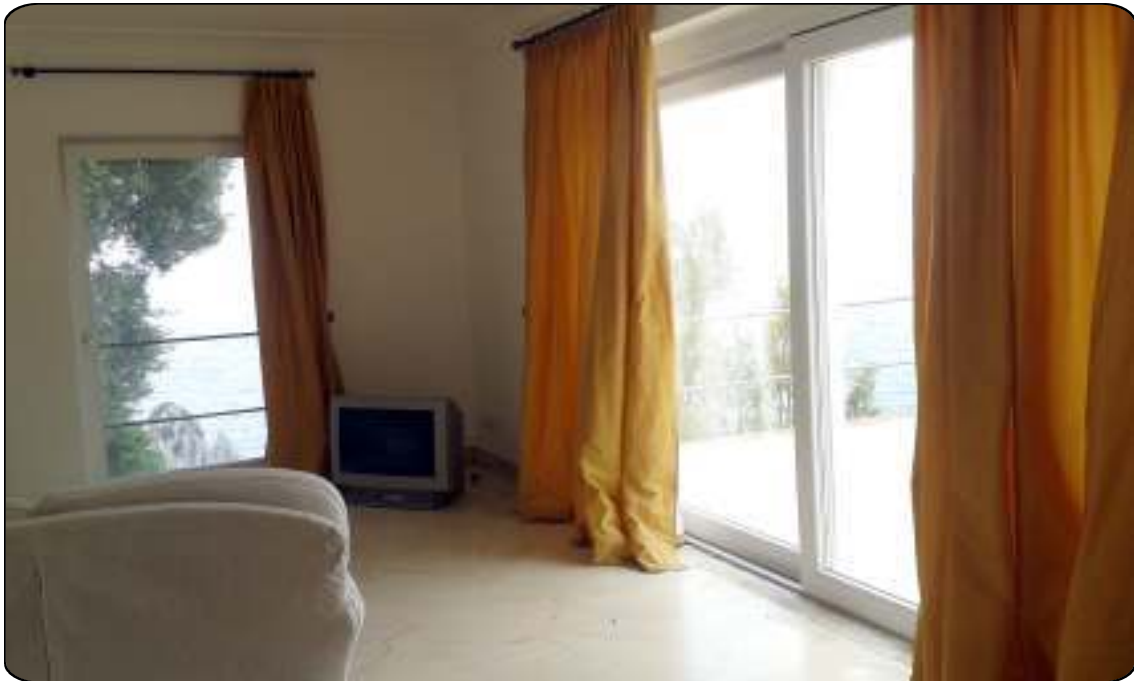
Foto 24- salone