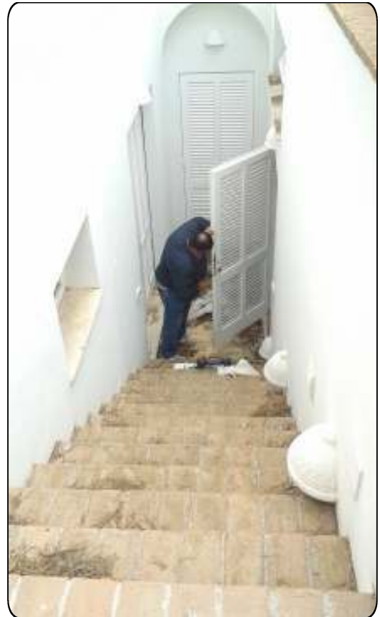
Foto 02- accessi ext zone cucina letto