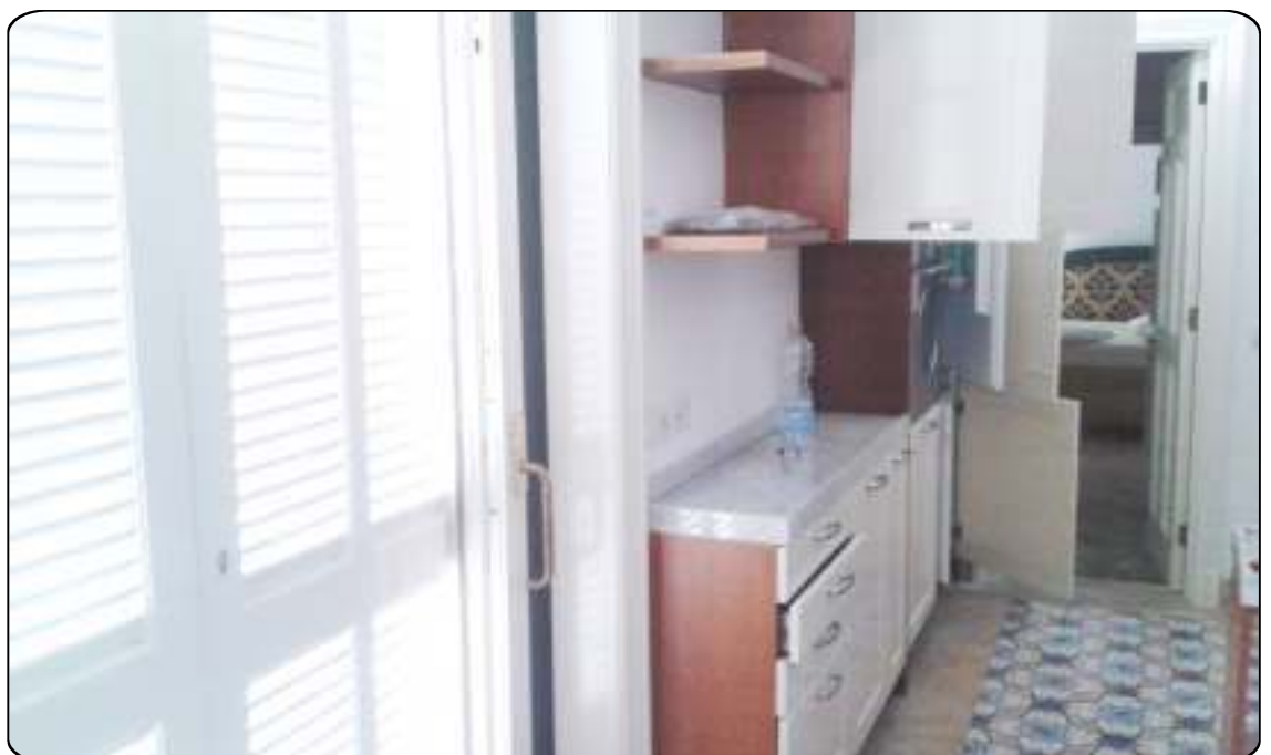
Foto 03- cucina