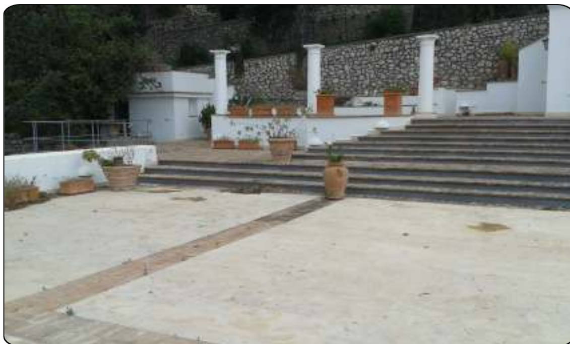
Foto 08- vista terrazzo e locale ext