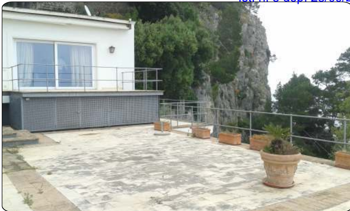
Foto 11- vista terrazzo