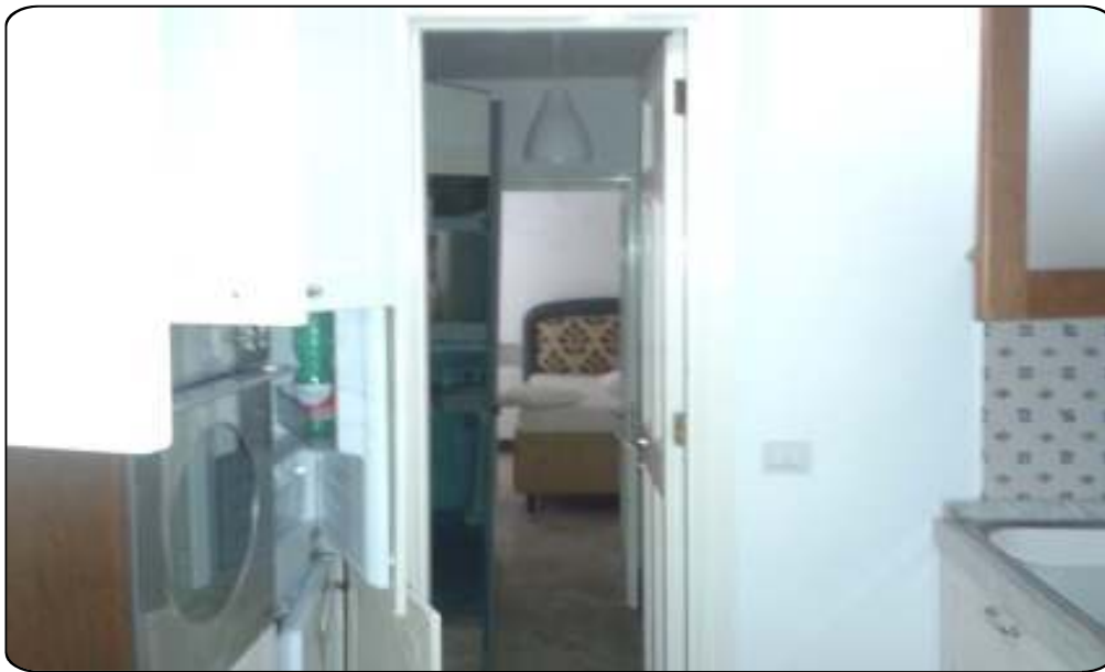
Foto 05- disimpegno vs letto 4