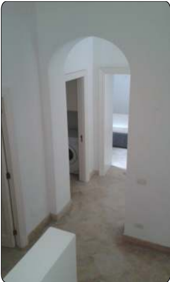
Foto 08- disimpegno piano inf