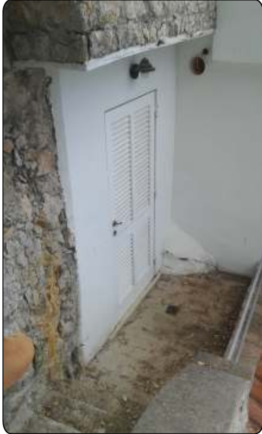
Foto 10- balconcino letto 1