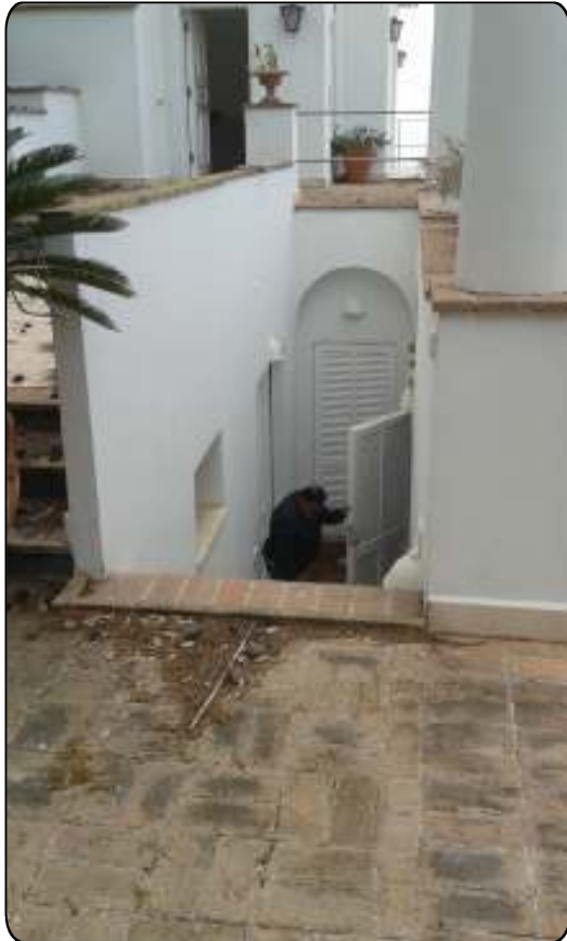
Foto 01- accesso ext piani inferiori