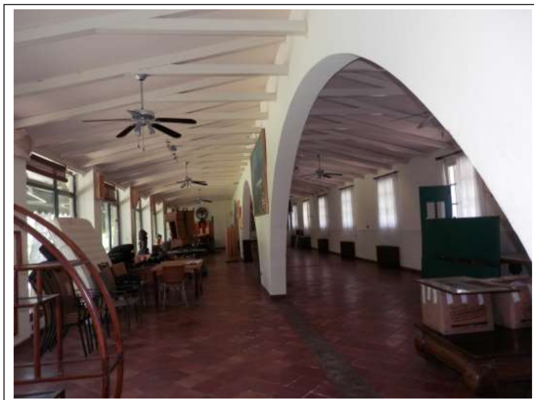
Fotografia n°8 – Vista della sala ristorante.