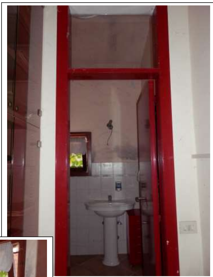
Fotografia n°19 – Vista del bagno dello studio medico.