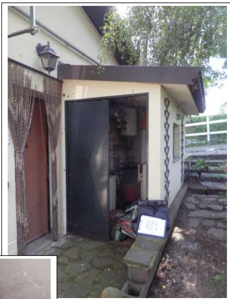
Fotografia n°21 – Vista dell'accesso alla C.T.