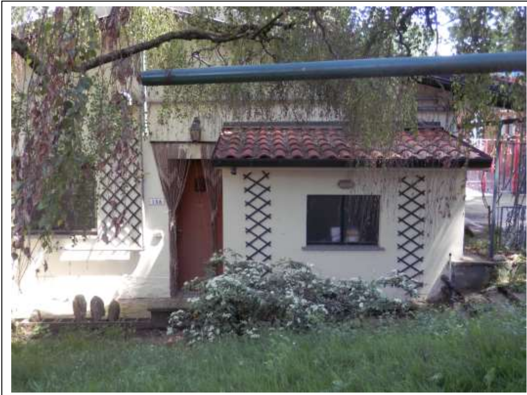
Fotografia n°15 – Vista della porta d'ingresso allo studio medico e del vano destinato a C.T.