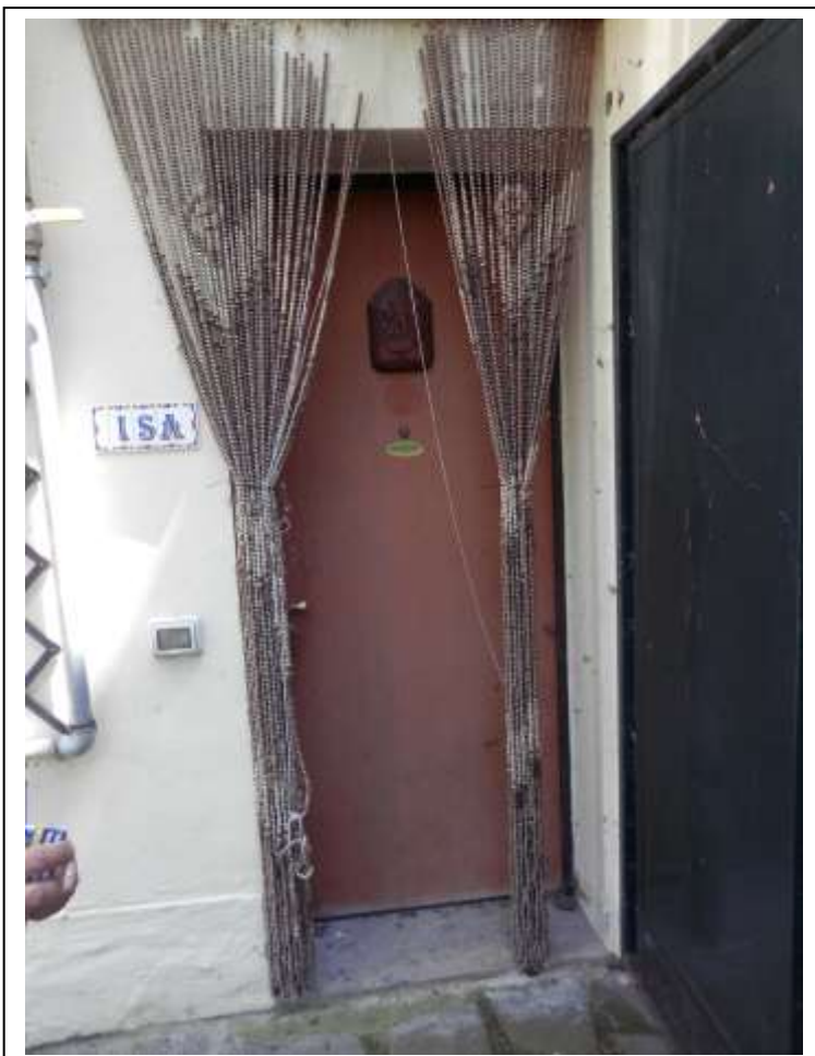
Fotografia n°16 – Vista della porta d'ingresso allo studio medico.