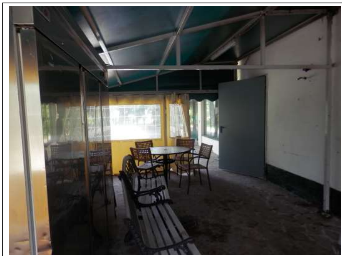
Fotografia n°4 – Vista della porta d'accesso alla cucina dalla porzione esterna di fabbricato protetta da tendaggio in plastica.