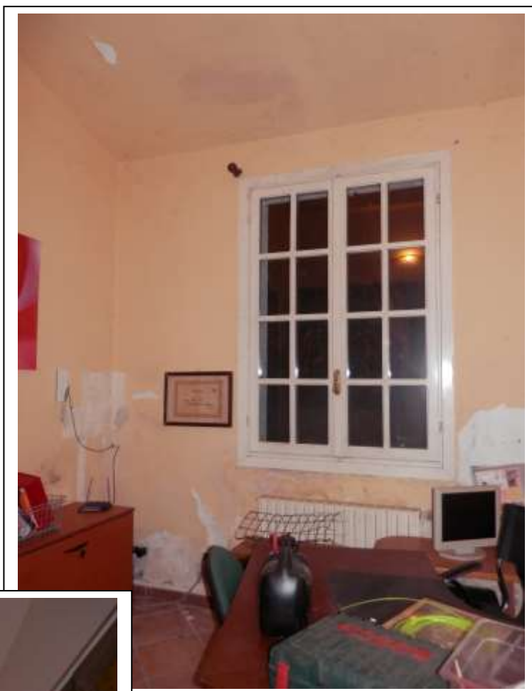
Fotografia n°17 – Vista dell'interno dello studio medico.