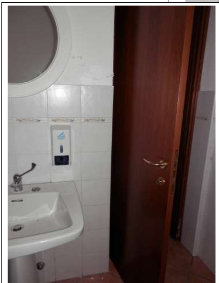
Fotografia n°14 – vista di uno dei servizi igienici del ristorante.