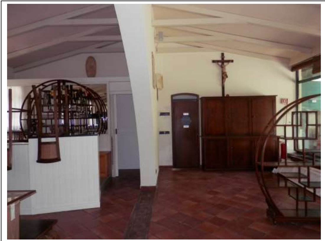
Fotografia n°11 – Vista della porta di collegamento tra la sala ristorante e la cucina.