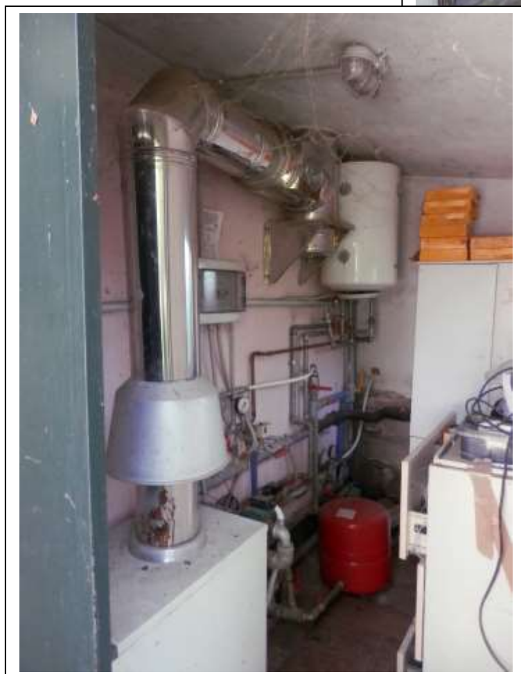
Fotografia n°22 – Vista dell'interno della C.T.