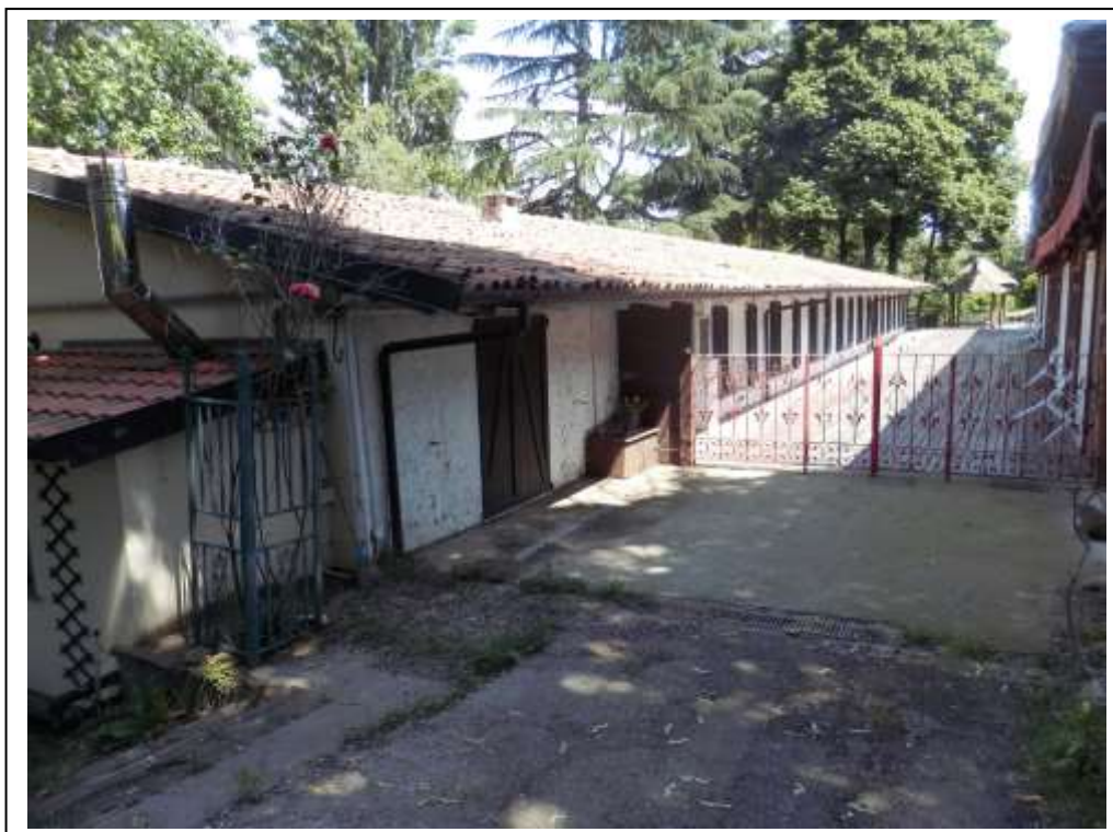
Fotografia n°2 – Vista del porticato sul fronte Sud del fabbricato.