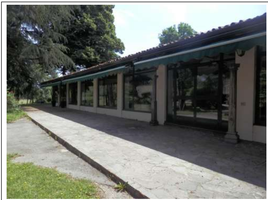
Fotografia n°1 – Vista del fronte Nord del fabbricato.

Corpo 5: Locali ad uso deposito posti al piano terra (fg.16, map.191, sub.2) - Attualmente sala ristorante