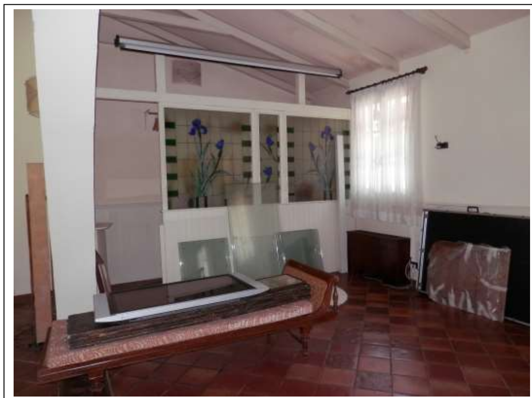
Fotografia n°10 – Vista del vano guardaroba all'interno della sala ristorante.