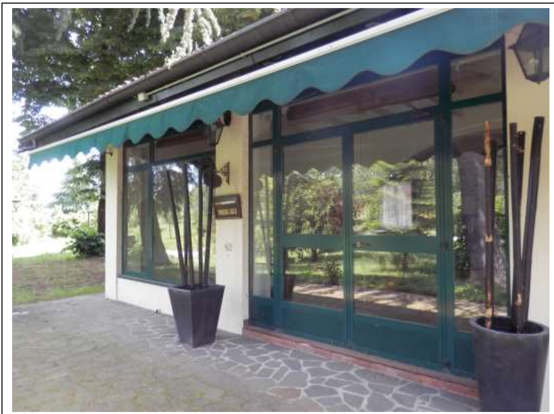
Fotografia n°7 – Vista di uno degli accessi alla sala ristorante.