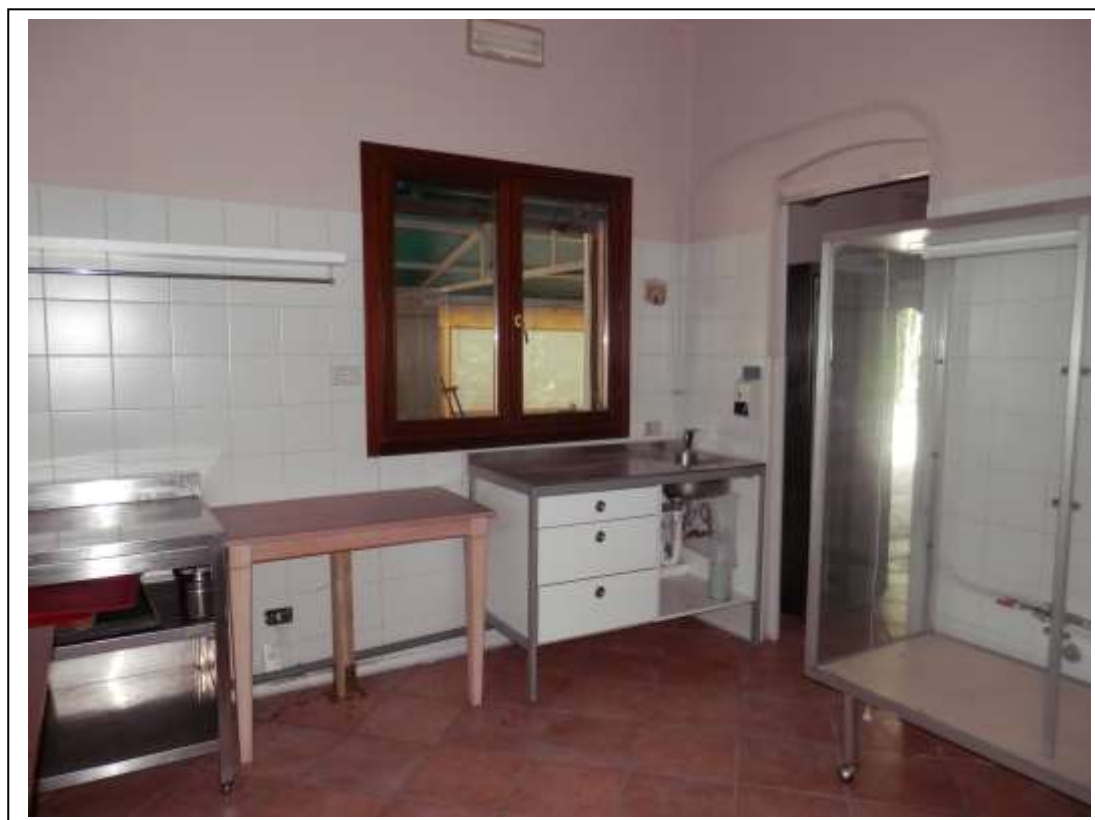
Fotografia n°6 – Vista del locale cucina indicato come “studio” nella planimetria catastale.