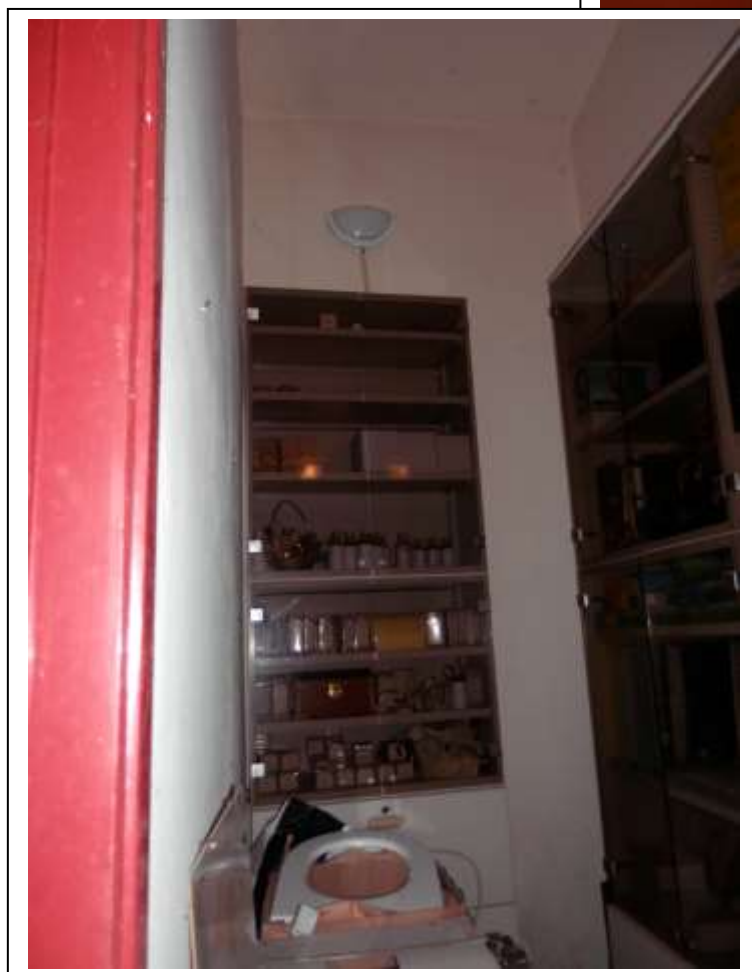
Fotografia n°18 – Vista del corridoio dello studio medico.