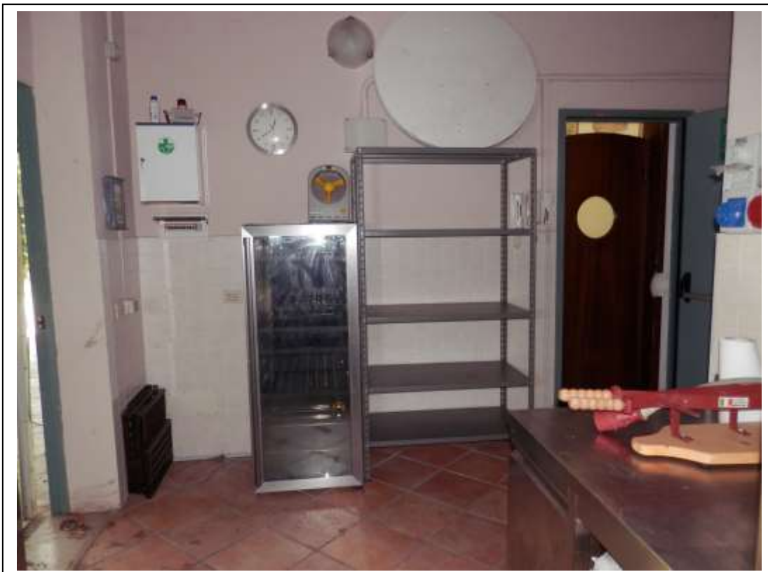
Fotografia n°5 – Vista del locale cucina con accesso dal fronte Nord del fabbricato.