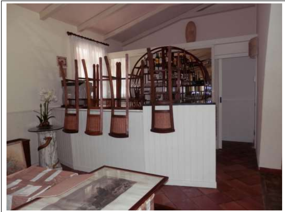
Fotografia n°12 – Vista del bancone bar all'interno della sala ristorante e dell'accesso al corridoio di distribuzione ai servizi igienici.