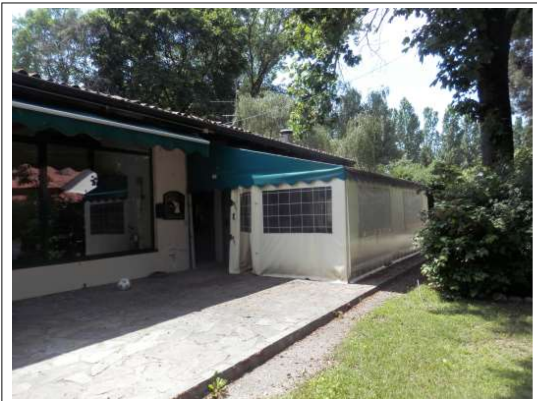
Fotografia n°3 – Vista della porzione esterna del fabbricato protetta da tendaggio in plastica con accesso alla cucina.