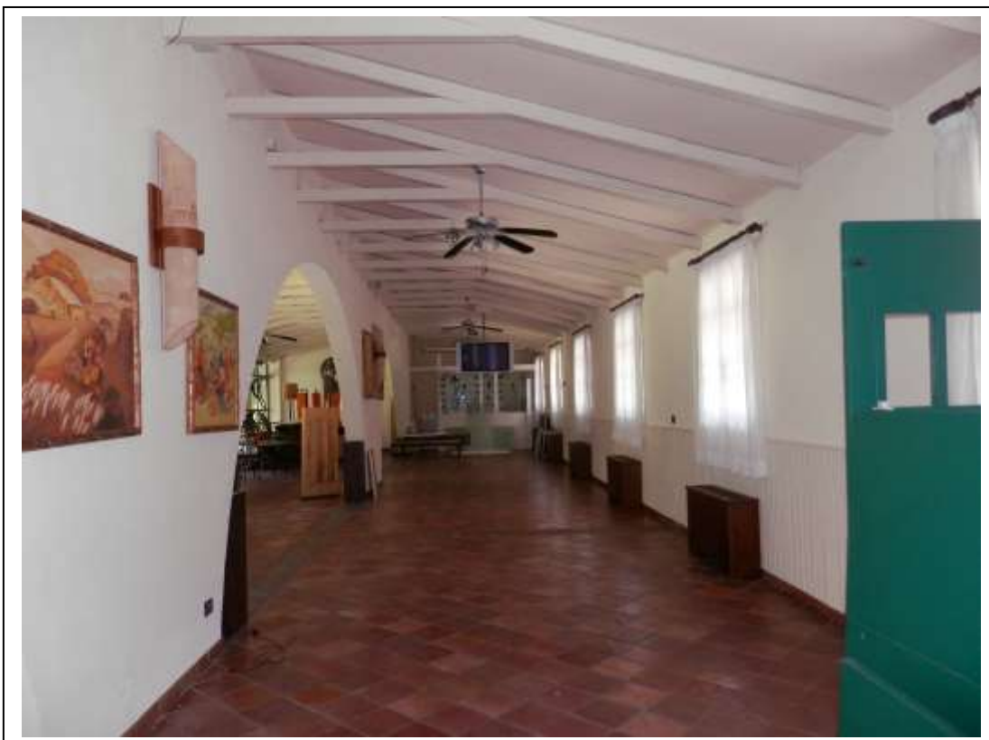
Fotografia n°9 – Vista della sala ristorante.