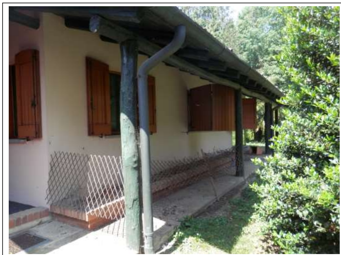
Fotografia n°2 – Vista del porticato sul fronte Nord del fabbricato.