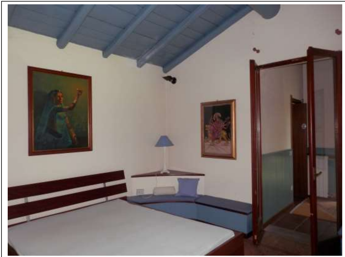
Fotografia n°8 – Vista della camera matrimoniale e dell'accesso alla veranda.