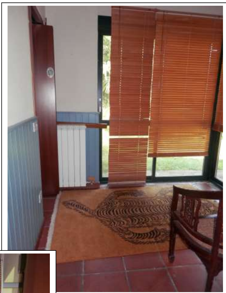
Fotografia n°9 – Vista della veranda.