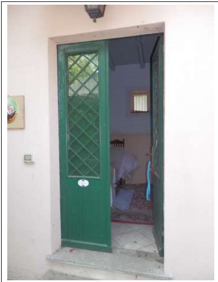
Fotografia n°11 – Vista della porta d'accesso alla camera indicata come cucina nella planimetria catastale.