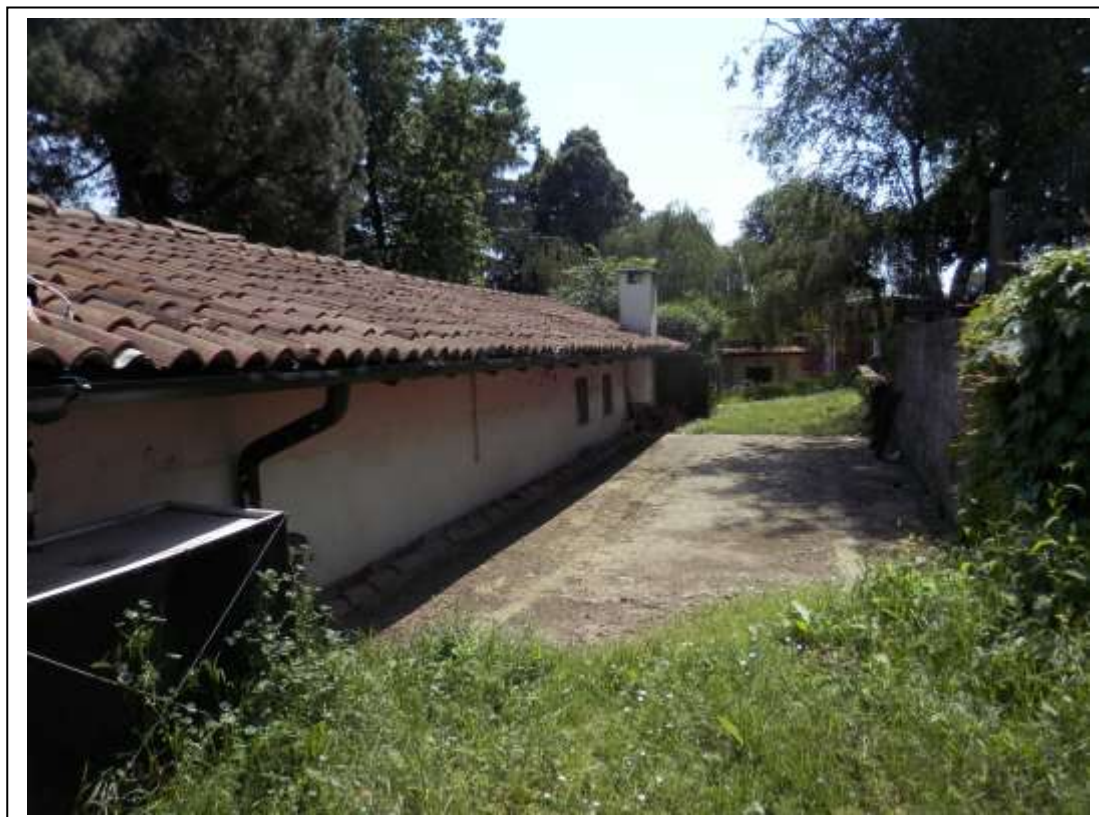
Fotografia n°4 – Vista del fronte Sud del fabbricato.