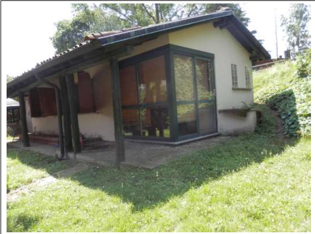
Fotografia n°3 – Vista della veranda dall'esterno.