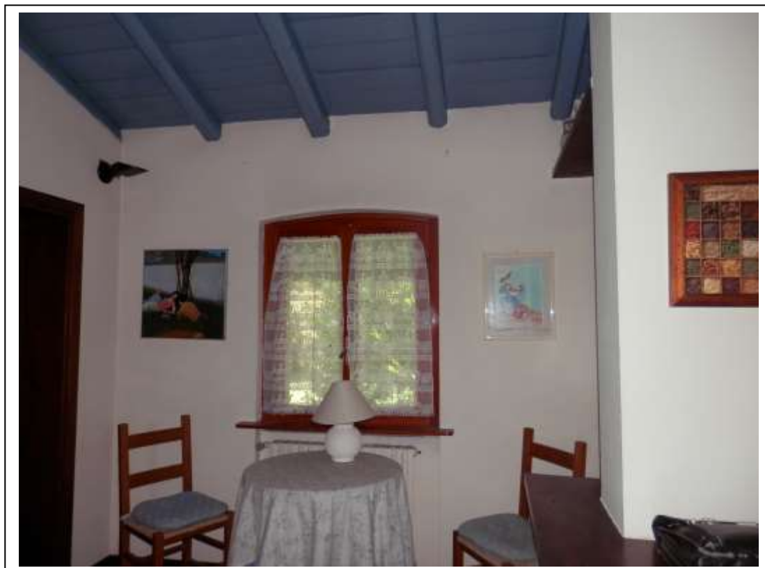
Fotografia n°6 – Vista della zona giorno/cucina.