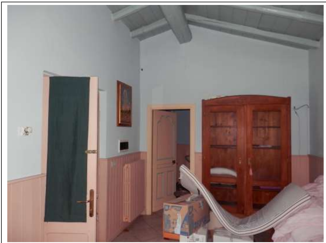
Fotografia n°12 – Vista camera indicata come cucina nella planimetria catastale.