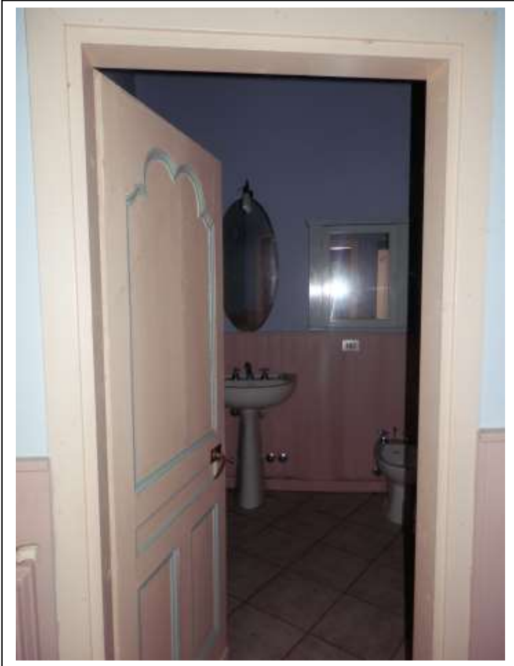
Fotografia n°13 – Vista del bagno con affaccio su fronte Nord.