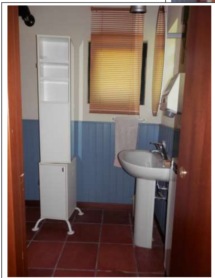
Fotografia n°10 – vista del bagno con accesso dalla veranda.