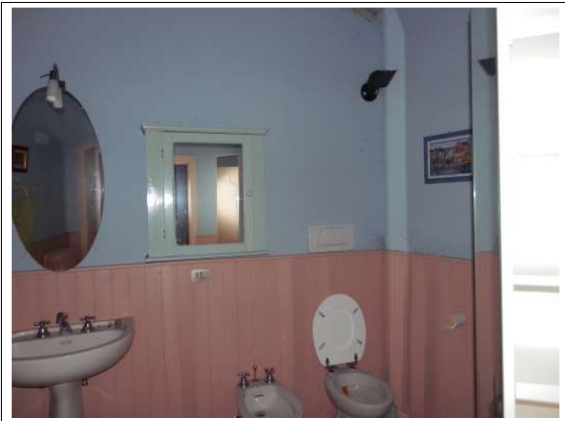
Fotografia n°14 – Vista del bagno con affaccio su fronte Nord.