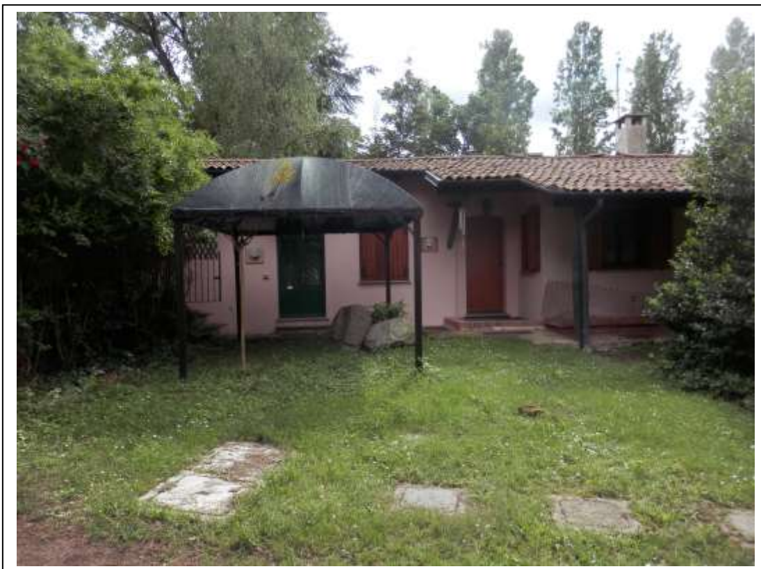
Fotografia n°1 – Vista del fronte Nord del fabbricato.