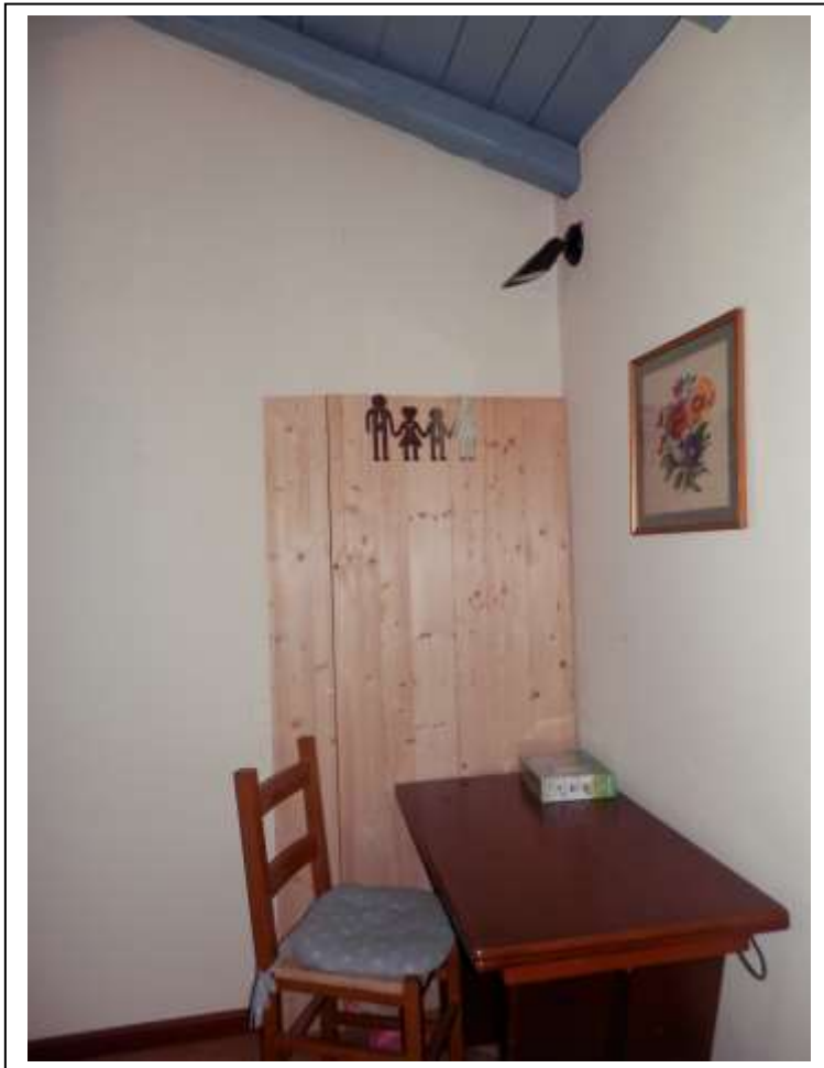
Fotografia n°7 – Vista del pannello provvisorio in legno posto a separazione tra la zona giorno e la camera indicato in planimetria catastale come cucina.